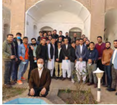
تور بیرجندگردی دانشجویان بین الملل دانشگاه بیرجند با همکاری شورای فرهنگی خوابگاه سرو، معاونت فرهنگی و اجتماعی و مرکز مشاوره و توانمندسازی دانشگاه بیرجند برگزار شد.

به گزارش امروز خراسان جنوبی، تور بیرجندگردی دانشجویان بین الملل دانشگاه بیرجند با حضور ۴۰ دانشجوی بین الملل مستقر در خوابگاه سرو برادران برای بازدید از اماکن تاریخی و گردشگری شهر بیرجند و آشنایی با فرهنگ، آداب و رسوم منطقه برگزار شد. در این برنامه فرهنگی دانشجویان از باغ اکبریه و موزه مردم شناسی، موزه عروسکها و موزه لباس، خانه پردلی، آب انبار، مدرسه شوکتیه، همچنین نمایشگاه صنایع دستی و گردشگری شهرستان بازدید کردند.