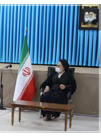
برگزاری اولین یادواره شهدای تربیت بدنی و سلامت آموزش و پرورش استان

کسب ۵۸ رتبه برتر در دومین فراخوان کتاب برتر مصاحبه از ۲۹۰ نفر از داوطلبان دانشگاه فرهنگیان برگزاری دوره آموزشی ویژه سالگرد شهادت سردار شهید حاج قاسم سلیمانی با شرکت بیش از ۴۰۰۰ نفر برگزاری دوره های آموزشی ویژه بیماری کرونا با شرکت ۶۰۰۰ نفر برگزاری دوره آموزشی به منظور آشنایی بیشتر با فرمایشات مقام معظم رهبری در خصوص آموزش و پرورش با شرکت ۹۷۰۰ نفر اجرای ساختار تشکیلاتی جدید اداره کل ابلاغی از سوی وزارت متبوع به صورت کامل تشکیل پرونده استخدام و صدور احکام استخدام پیمانی نیروهای ماده ۱۵۴ تعداد ۱۵۴ نفر جذب تعداد ۱۲۳ نفر نیروی حق التدریس آزاد جدید از محل معلمان حق التدریس و آموزشیاران نهضت سوادآموزی تکمیل فرم امتیازبندی مشمولین تبدیل وضعیت استخدامی قانون تعیین تکلیف خدماتی معلمان حق التدریس و آموزشیاران نهضت سوادآموزی به صورت الکترونیک و بدون مراجعه ارباب رجوع و ارسال اطلاعات افراد مشمول (تعداد ۷۲۴ نفر) به وزارت متبوع ساماندهی کامل نیروی انسانی استان با توجه به بازنشستگی بیش از ۴۰۰ نفر از نیروها و کمبود ۱۶۰۰ نیرو به نحوی که در ابتدای سال تحصیلی هیچ کلاسی خالی از معلم نبوده است. حذف مدارس کلتسی بیش از ۱۰ دانش آموز استان حذف کامل بخاری نفتی و استانداردسازی سیستم گرمایشی مدارس استان افزایش ۲۷۹ کلاس درس در استان