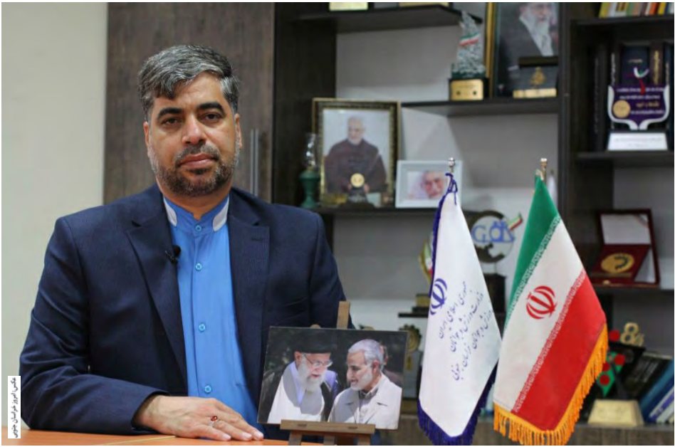
مدیرکل ورزش و جوانان خراسان جنوبی

عزیزی در بحث جوانان عنوان کرد: ما در کمیته ورزش و جوانان سه رویکرد مهم را دنبال می‌کنیم و ما به عنوان کمیته ورزش و جوانان، یک کمیته سیاستگذاری، نظارت، هماهنگی و ارزیابی هستیم و ایجاد هم افزایی به منظور تقویت رویکردهای مردمی برای پاسداشت جشن‌های انقلاب موضوعات را دنبال می‌کنیم و هیات‌های ورزشی و سازمان‌های مردم نهاد جوانان، مساجد و تمامی بخش‌های مردمی مثل بسیج که در کف میدان هستند، قرار است برنامه‌ها توسط آنان انجام شود. وی افزود: نکته دوم، جهاد تبیینی است که در فرمایش مقام معظم رهبری به بحث روشننگری، با جدیت به آن