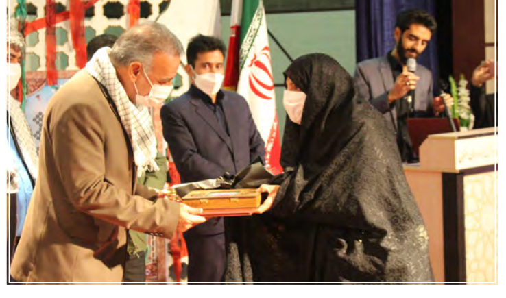
کسب رتبه سوم کشوری در هفدهمین جشنواره الگوهای تدریس برتر در دروس ریاضی و شیمی

کسب مقام اول، دوم و برتر معلم پژوهنده کشور توسط معلمان پژوهشگر استان کسب رتبه ره های اول، دوم و سوم استان در جشنواره پژوهشگران برتر