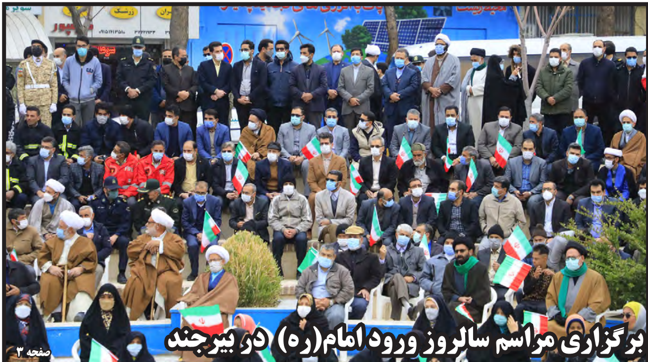
برگزاری مراسم سالروز ورود امام (ره) دو بیرجند