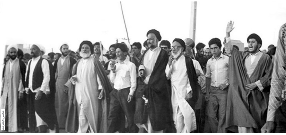
ارتش از شهرهای همجوار برای کمک آن ها اعزام شد و قاین را وضعیت قرمز اعلام و حتی عبور سه نفر در شب را ممنوع کردند.