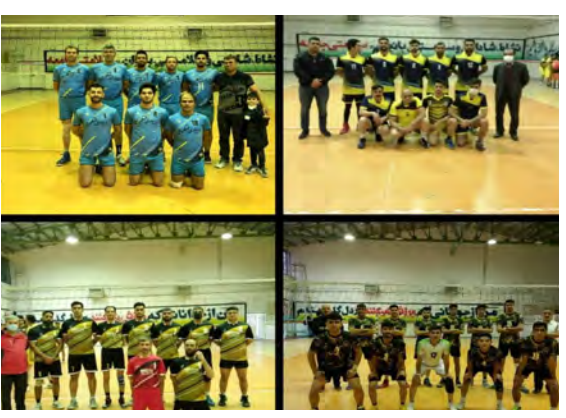
گروه ورزش / دانش

فینال مسابقات والیبال جام فجر با حضور مسئولین در بیرجند برگزار شد. به گزارش امروز خراسان جنوبی، بازی نهایی مسابقات والیبال جام فجر انقلاب اسلامی ایران جام قهرمانی گرمیداشت شهیدان حاج قاسم سلیمانی در سالن ورزشی حجاب با حضور مردم و مسئولان با رعایت پروتکل های بهداشتی برگزار و قهرمان این رقابتها مشخص شد. در دیدار پایانی این رقابتها دو تیم سپاهان جوان و راه و شهرسازی در مقابل یکدیگر قرار گرفتند و پس از نمایش یک بازی جذاب، راه و شهرسازی موفق شد با شکست ۳ بر ۲ سپاهان جوان عنوان قهرمانی این رقابتها را از آن خود نماید و سپاهان جوان نایب قهرمان شد. تیم های استانداری و دهکده منظره نیز به ترتیب عنوان سومی و چهارمی این مسابقات را کسب کردند. مراسم اختتامیه مسابقات والیبال جام فجر انقلاب اسلامی ایران جام قهرمانی گرمیداشت شهیدان حاج قاسم سلیمانی در سالن ورزشی حجاب با حضور رئیس اداره ورزش و جوانان پیشکسوتان هیات والیبال، نماینده استانداری و راه و شهرسازی و علاقمندان با اهدای کاپ و حکم قهرمانی و لوح یادبود به برترینها برگزار و از سه تیم برتر این رقابتها تقدیر شد.