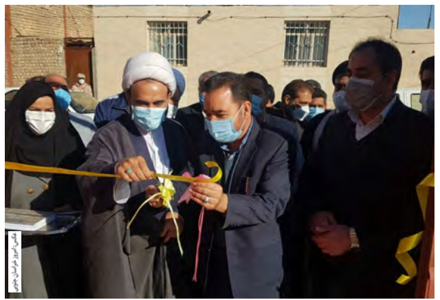
واحد مسکن محرومین و اقشار کم درآمد بهزیستی در شهر حاجی آباد این شهرستان برگزار شد. این

گفتنی است: از سال ۹۸ تاکنون برای یکصد واحد مسکونی معلولین تحت پوشش بهزیستی وام بلاعوض اعطا شده است که ۹۰ واحد روستایی و ۱۰ واحد شهری بوده است. برگزاری آیین افتتاح طرح آبیاری کم فشار در سطح ۵۳ هکتار از اراضی روستای مرزی بارنگان زیرکوه نیز از دیگر برنامه های هفتمین روز از دهه مبارک فجر در این شهرستان بود و برای این طرح اعتباری بالغ بر ۵۴۷ میلیون تومان هزینه شده که خدبایری مردم ۸۰ میلیون تومان و مابقی توسط جهاد کشاورزی پرداخت شده است و با افتتاح این پروژه ۴۲ خانوار از مزایای این طرح بهره مند خواهند شد.