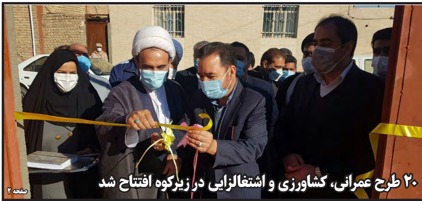
۲۰ طرح عمرانی، کشاورزی و اشتغالزایی در زیرکوه افتتاح شد

سکوت دستگاه های نظارتی در مورد خشکاندن درختان