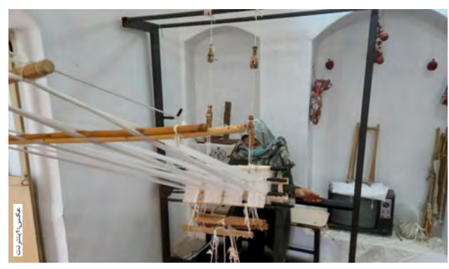
حوزه های سه گانه میراث فرهنگی، صنایع دستی و گردشگری تا پیش از اشتغال و تولید است اشتغال در ۱۵۰ درصد انجام شود.

به گفته فولادی طی دو سال گذشته اعطای تسهیلات مشاغل خانگی از سوی دستگاه های متولی انجام نشده است. رئیس اداره میراث فرهنگی، گردشگری و صنایع دستی شهرستان بیرجند گفت: پیش از ۱۰۰ درصد سهمیه اشتغال اداره میراث فرهنگی شهرستان بیرجند محقق و در سامانه ثبت اشتغال رصد ثبت شده است. او گفت: در ابتدای سال با تصویب کمیته اشتغال مقرر شد اشتغال ۲۱۱ نفر به این اداره محول شود که با توجه به برنامه ریزی انجام شده این تعداد به ۲۲۵ نفر معادل پیش از ۱۰۰ درصد تعهد این اداره رسید.