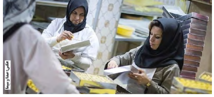
سامانه حمایت از مشاغل خانگی با ساز و کار جدید در خراسان جنوبی آغاز به کار کرد.

مدیر کل تعاون ، کار و رفاه اجتماعی خراسان جنوبی تاکید کرد: سامانه حمایت از مشاغل خانگی برای تسهیل امور مردم و حمایت از توسعه اشتغال با ساز و کار جدید فعال شد. وی افزود: بر اساس سیاست‌های جدید وزارت تعاون، کار و رفاه اجتماعی برای مشاغل ثبت محور، پس از درخواست متقاضی و تکمیل فرم، تاییدیه به صورت آنی صادر می‌شود و در رشته‌های مجوز محور هم روند دریافت مجوز تسهیل شده و پس از تکمیل فرم ثبت نام توسط متقاضی، طرح و درخواست متقاضی حداکثر ظرف مدت سه روز از سوی دستگاه اجرایی مربوط بررسی خواهد شد و در صورت عدم بررسی طرح در مدت زمان تعیین شده، مجوز به صورت خودکار صادر می‌شود.