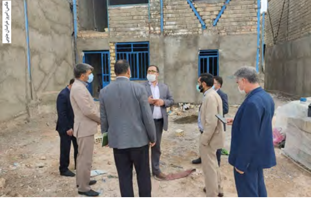
داعی مدیرکل راه و شهرسازی خراسان جنوبی در بازدید از پروژه ساخت مسکن مددجویان قاین

به همت اداره کل زندان های خراسان جنوبی، انجمن حمایت از زندانیان قاین و اداره کل کمیته امداد استان، ۱۶۰ میلیون تومان برای تکمیل چهار واحد مسکونی خانواده زندانیان نیازمند اختصاص می یابد. به گزارش روابط عمومی کمیته امداد خراسان جنوبی، مدیرکل زندان های استان و دادستان قاین از پروژه های مسکن در حال احداث کمیته امداد شهرستان قاین بازدید کردند. روشان در این بازدید اعلام کرد: ۳۵ میلیون تومان اعتبار از سوی اداره کل زندان های استان و انجمن حمایت از زندانیان شهرستان