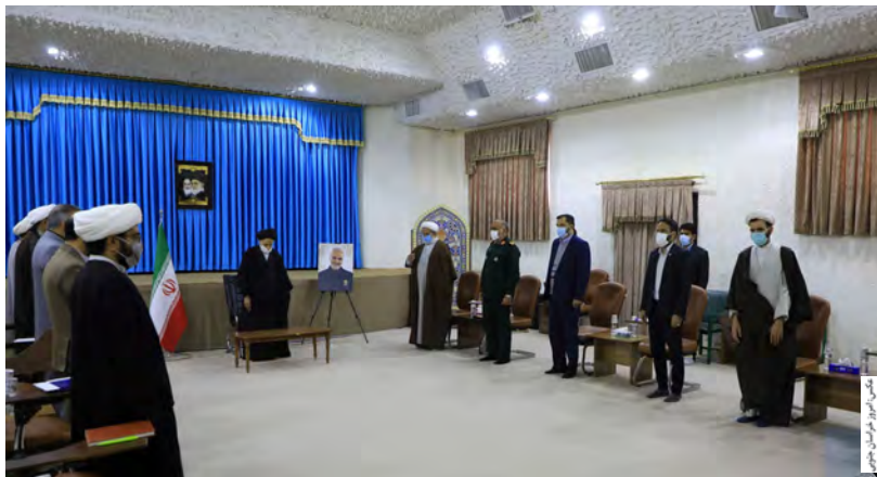
معاون استاندار مطرح کرد: