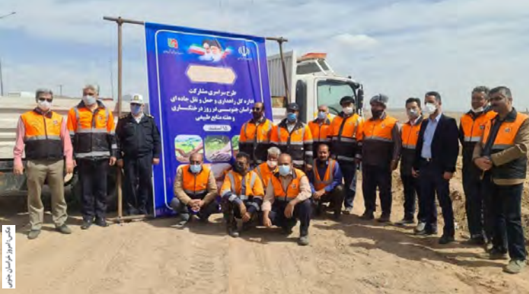
مدیرکل راهداری و حمل و نقل جاده‌های خراسان جنوبی در کنار یک دستگاه کامیون حامل نهال کاشته شده در جاده‌های استان خراسان جنوبی.

طرح سراسری مشارکت سازمان راهداری و حمل و نقل جاده‌ای در روز درختکاری و هفته منابع طبیعی در خراسان جنوبی با حضور مدیر کل، معاون راهداری و راهداران اداره شهرستان بیرجند اجرا شد. به گزارش امروز خراسان جنوبی، مدیرکل راهداری و حمل و نقل جاده‌ای خراسان جنوبی در این مراسم گفت: طرح مشارکتی سراسری با هدف ترویج فرهنگ درختکاری در بین اقشار مختلف جامعه، کنترل آلودگی محیط‌زیست و ارتقای کیفیت آن و تقویت روحیه مشارکت در توسعه و نگهداری فضای سبز است.