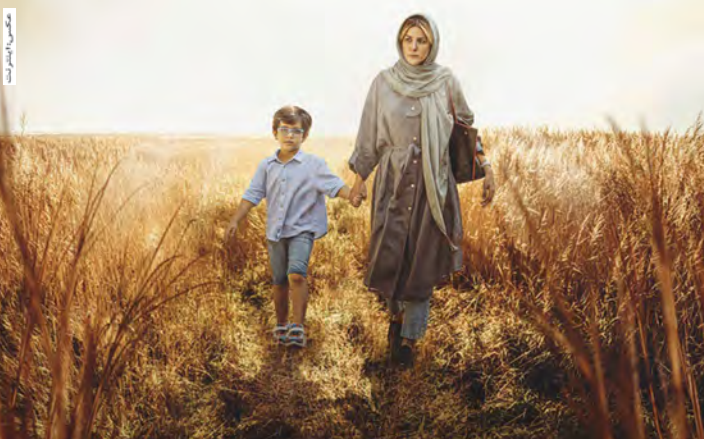
ایرج طهماسب در فیلم «بدون مهرجویی» با بازی سحر مصیبی و سحر مرادی

ایرج طهماسب کارگردان آثار خاطره‌انگیز سینما و تلویزیون ایران پس از ۴۰ سال از آخرین ساخته خود، این‌بار با مجموعه نمایشی تازه‌ای به شبکه نمایش خانگی برمی‌گردد. جدیدترین کار ایرج طهماسب در حال گذراندن آخرین مرحله پیش‌تولید می‌شود.