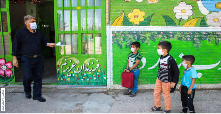
مدیران مدارس در مشهد با کودکان و نوجوانان در یک مدرسه در مشهد.