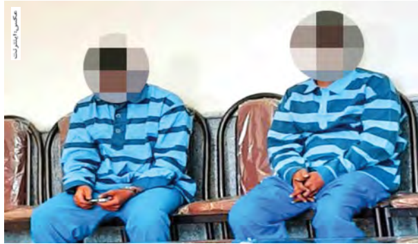
امدادگران همسر را معاینه کردند، گفتند که او فوت کرده است. مرد میانسال گفت: همسرم مشکل عصبی داشت و خیلی زود ناراحت می شد. مدتی قبل من بر سر یک ملک با خواهرم اختلاف پیدا کردم و خانوادهاش مدام برای ما ایجاد مزاحمت کرده و ما را اذیت می کردند.

۶. سعی نکنید کامل باشید. احساس نکنید که باید همه کارها را انجام دهید. ۷. از انجام دو یا سه کار همزمان اجتناب کنید. ۸. اگر ممکن است، میزان صداهای اطرافتان را کم کنید. ۹. همیشه برای صرف ناهار زمانی خاص در نظر بگیرید. (خارج از پشت میز کاریتان) ۱۰. سلامت خود را با غذا، خواب و استراحت کافی بالا ببرید. ۱۱. مرتب ورزش کنید.