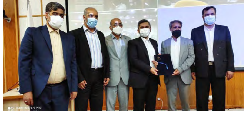
مصوب سفر رئیس جمهور به خراسان جنوبی به ۸۴ میلیارد تومان می‌رسد.

زیرساخت‌های ورزشی استان اشاره کرد و خواستار توجه ویژه وزارت ورزش و جوانان به این موضوع شد. محمدرضا طالبی با بیان اینکه در دولت جهادی آیت ا... رئیسی انتظار ما از وزارت ورزش و جوانان این است که توجه ویژه‌تری به خراسان جنوبی شود، افزود: پرورش نسل جوان از نظر جسمی، روحی و روانی از عمده وظایف وزارت ورزش و جوانان است. وی بر لزوم جهاد تبیین در حوزه جوانان با توجه به همه‌های مختلف دشمنان تأکید کرد و ادامه داد: معاندین نظام اسلامی ایران با حدود ۱۹ هزار رسانه