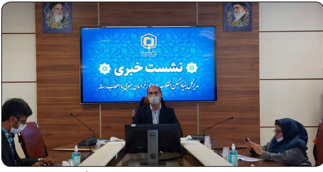
مورد تأیید نهایی و پالایش هستند. ۱۰۶۲ اسناد شهری بوده است.

مدیرکل بنیاد مسکن انقلاب اسلامی استان خبر داد: