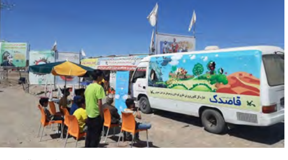
مدیر کل کانون استان طی سفر به شهرستان درمیان با مدیر آموزش و پرورش این شهرستان دیدار و در خصوص تعامل بیشتر دو مجموعه در خدمات رسانی به کودکان و نوجوانان این شهرستان مرزی گفت و گو کرد.