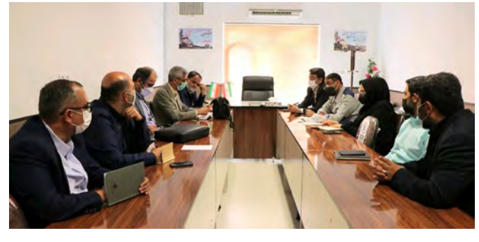
تعیین تکلیف در مدت زمان معین برابر قانون نسبت به سلب صلاحیت از بهره برداران این معدن اقدام و این

مدت جلسات متعددی در مرکز استان و شهرستانها برگزار شده است گفت: این جلسات در سال جاری و در شهرستانها نیز ادامه خواهد داشت. وی افزود: در این راستا جلسه تعیین تکلیف معدن راکد و غیرفعال در شهرستان طبس با محوریت معادن سیلیس با حضور بهره برداران پنج معدن غیرفعال تشکیل شد و بهره برداران مکلف به تعیین تکلیف معدن در مدت زمان ۳ تا ۶ ماهه شدند. رییس سازمان صنعت، معدن و تجارت خراسان جنوبی گفت: در صورت عدم