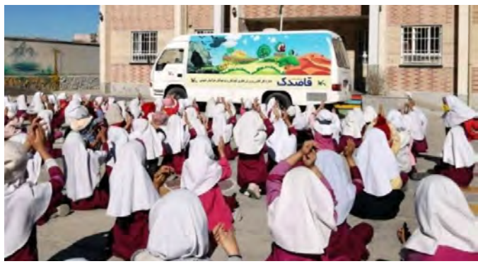
وی افزود: این برنامه در راستای استفاده از ظرفیت حضور خانواده ها و همچنین معرفی برنامه های فرهنگی و هنری کانون شامل نمایش عروسکی، قصه گوئی، آموزش کاغذ و تا(اورپیگامی) برگزار خواهد شد.

آموزش کاغذ و تا(اورپیگامی) برگزار خواهد شد. گفتنی است با توجه به برنامه ریزی انجام شده کاروان پیک امید کانون استان با بهره گیری از خودروی هنرهای نمایشی کانون استان به مدت شش شب در تاریخ های ۲۴ و ۲۵ فروردین ماه در محل ورودی بوستان کاجستان بیرجند، ۲۸ و ۲۹ فروردین در بوستان ابتدای جاده سلامت در خیابان شهید آوینی و ۷ و ۸ اردیبهشت ماه در مسیر بلوار منطقه گردشگری بند دره بیرجند از ساعت ۹ تا ۱۱ میزبان کودکان ونوجوانان و خانواده ها خواهد بود.