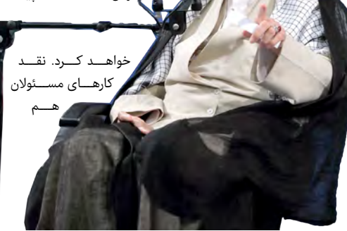
خواهد کرد. نقد کارهای مسئولان هم

حضرت آیت ا... خامنه ای رهبر معظم انقلاب در دیدار رضائیان مسئولان نظام فرمودند: در برنامه‌ریزی‌های کاری مطلقاً معطل مذاکرات هسته‌ای نشوید و کار خودتان را جلو ببرید. اینجور نشود که اگر مذاکرات به نتایج مثبت یا نیمه مثبت یا منفی رسید، در کار شما خللی ایجاد شود. کار خودتان را بکنید. در مذاکرات هم کار به گونه خوبی پیش می‌رود و هیئت مذاکره کننده، رئیس‌جمهور و شورای عالی امنیت ملی و دیگران را در جریان می‌گذارند و تصمیم می‌گیرند و جلو می‌روند. هیئت مذاکره کننده ما هم تا اینجا در برابر زیاده‌خواهی‌های طرف مقابل مقاومت کرده است و ان شاء... ادامه پیدا