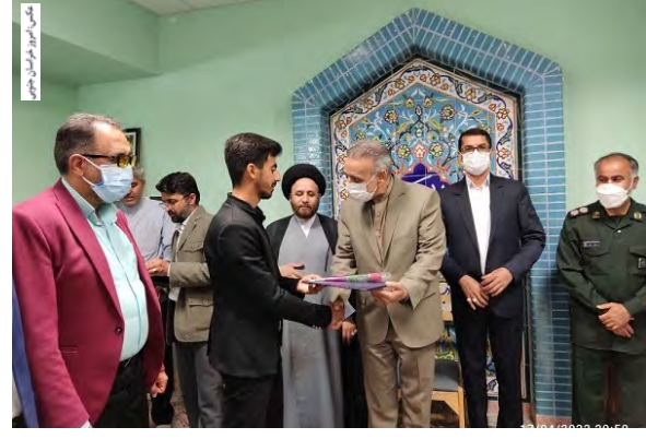
مدیرکل آموزش و پرورش خراسان جنوبی گفت: میزان تعهدات خیرین در سال گذشته ۴۵ میلیارد تومان بوده است که تا پایان سال، ۲۰ میلیارد آن، به میزان ۴۰ درصد، محقق شده است.

خیرین، در سالروز میلاد کریم اهل بیت برگزار شد، تصریح کرد: این تعهدات توسط ۶۴ تن از خیرین نیکوکار استان برای ساخت و تکمیل طرح های آموزشی، تربیتی، عمرانی و کمک آموزشی ایجاد شده بود. وی، با اشاره به تعهد ۲۵ میلیاردی ۶ نفر از خیرین مدرسه ساز شهرستان بشرویه در سال ۹۹، عنوان کرد: تا کنون مبلغ ۸ میلیارد این تعهدات محقق شده است. مدیرکل آموزش و پرورش خراسان جنوبی، با بیان این مطلب که خیرین نماد انسان های بزرگ منش و بلند کردارند، بیان کرد: خیرین مدرسه ساز، سفیران مهر و دوستی، الگوی محبت و بازوان توانمند خادمین نظام تعلیم و تربیت در مدارس را فراهم کند.