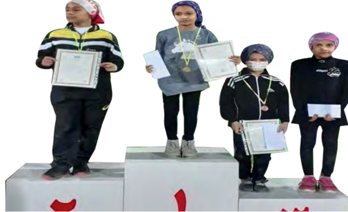
معرفی سریع ترین های جام رمضان «بیر جند» صفحه ۷