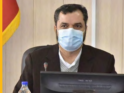
ایجاد مرکز ماده ۱۶ از اولویت های مهم حوزه مبارزه با مواد مخدر است صفحه ۴

معاون عمرانی استاندار خراسان جنوبی عنوان کرد: