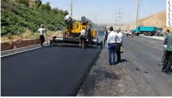
و حمل و نقل جادهای خراسان جنوبی یادآور شد: تناژ کل لکه گیری های انجام شده نیز ۱۳۷۳ تن بوده است.

معاون راهداری ادارهکل راهداری و حمل و نقل جادهای خراسان جنوبی از اجرای بیش از ۲۵ کیلومتر روکش آسفالت گرم و حفاظتی در جاده های استان از ابتدای سال ۱۴۰۱ خبرداد. به گزارش امروز خراسان جنوبی برای ارتقای ایمنی محورهای مواصلاتی استان و رفاه حال کاربران جاده ای از ابتدای سال ۱۴۰۱ در سطح جاده های استان بیش از ۲۵ کیلومتر روکش آسفالت اجرا شده است.