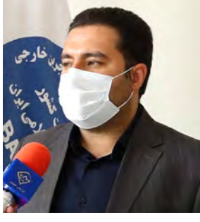
مدیر کل امور اتباع و مهاجرین خارجی استانداری خراسان جنوبی از شناسایی ۱۰ هزار تبعه خارجی مجاز در خراسان جنوبی خبر داد.

مرکز خراسان جنوبی، مدیر کل امور اتباع و مهاجرین خارجی استانداری خراسان جنوبی با بیان اینکه تا کنون ۱۰ هزار تبعه خارجی مجاز در خراسان جنوبی شناسایی شده است، گفت: اتباع خارجی ساکن در خراسان جنوبی غالباً دارای کارت آمایش هستند و برخی از اتباع خارجی دارای گذرنامه خانوادگی بوده و یا به واسطه طرح های سرشماری وزارت کشور شناسایی می شوند.