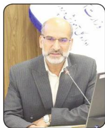
جهاد تبیین باید مستمر باشد

ها، کاستی‌ها را هم ببینیم و به دنبال راهکار باشیم. وی با تأکید بر اینکه ما باید دانش آموزان سرباز تمدن اسلامی تربیت کنیم، ادامه داد: در سال ۲۰۲۰ ناتو پنج حوزه جنگی با دشمنان آمریکا تعریف کرده و اخیراً حوزه جدیدی که برای مبارزه معرفی کرده جنگ شناختی است که باید مدنظر هیات‌های اندیشه‌ورز باشد. وی با اشاره به اینکه این جنگ روی اعصاب و روان افراد تأثیر می‌گذارد، گفت: باید حواسمان باشد که در موج‌سواری بیگانگان قرار نگیریم.