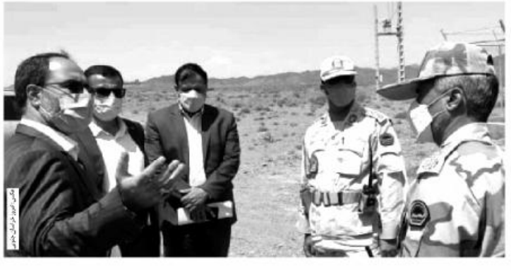
در ۲ حوزه باید به مرز توجه شود گفت: حوزه اول تامین امنیت مرز و زیرساخت های معاون استاندار خراسان جنوبی

وی حوزه دوم را استفاده از ظرفیت های مرز برای توسعه اقتصادی عنوان کرد و افزود: در این زمینه مرزهای موجود در چهار شهرستان مرزی خراسان جنوبی این قابلیت را دارند که به حداکثر ظرفیت و توانمندی خود برای مبادلات مرزی و توسعه اقتصادی دست یابند.