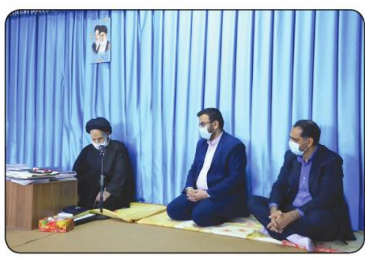
است. وی از رونمایی سامانه گزارش گیری امید سخن گفت که طی این سامانه کلیه فعالیت‌های اداری، پرستاری، درمانی، انبار، مشارکت‌ها و... در بستر شبکه‌ای ثبت و ذخیره می‌شود که خود امکان دسترسی لحظه‌ای به آمار گزارشات را امکان پذیر کرده است. مدیرعامل مؤسسه خیریه توانبخشی حضرت علی اکبر (ع) ابراز داشت که بزرگترین و تنها

پروژه آبدارمانی استان خراسان جنوبی بعد از ده سال در دهه مبارک فجر ۱۴۰۰ افتتاح و همچنین بهره‌برداری از ۲ پروژه عمرانی سالن ورزشی و اردوگاه بزرگ ۱۸ هزار متری ویژه معلولان را در دستور کار سال جاری دارد. حضرت حجت الاسلام عیادی، نماینده محترم ولی فقیه در استان پس از استماع سخنان مدیرعامل مؤسسه خیریه توانبخشی حضرت علی اکبر (ع) ضمن عرض خوشامدگویی کار در مجموعه حضرت علی اکبر (ع) را یک کار دلی و از سرشوق دانست و با اشاره به حدیث «و ستخدمنی فی مرضاتک» گفت که خداوند را بر این توفیق شاکر باشید. نماینده ولی فقیه در استان با توجه به میزان صرفه جویی که در توانبخشی حضرت علی اکبر (ع) صورت می‌گیرد، افزود: این یک سبک زندگی اسلامی است و آنقدر آن را با اهمیت دانستی که پیشنهاد دادند آن را کتابچه‌ای کرده و در اختیار همگان قرار دهید تا این سبک زندگی صرفه جویانه و اسلام‌آبانه را فرا بگیرند.