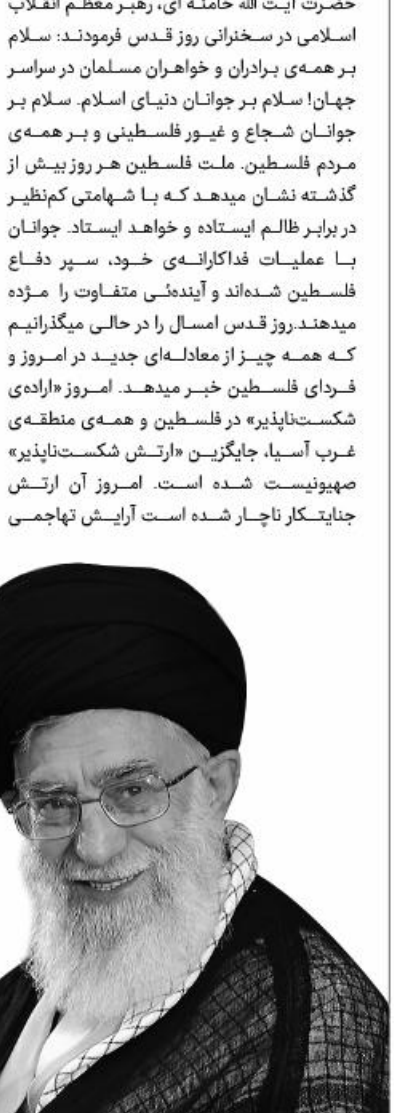
عادی سازی روابط با رژیم صهیونیستی مانند پرورش مار در آستین است

خود را به تدافعی تبدیل کند. امروز در میدان سیاسی، مهمترین حامی رژیم غاصب، یعنی آمریکا، خود دچار شکستهای بی دریسی شده است. شکست در جنگ افغانستان، شکست در سیاست فشار حداکثری بر ایران اسلامی، شکست در برابر قدرت های آسیا، شکست در کنترل اقتصادی جهان، شکست در مدیریت داخلی خود و پدیده شکاف عمیق در حاکمیت آمریکایی. این در حالی است که بیست سال پیش، رژیم غاصب در پاسخ به کشته شدن چند صهیونیست در نهاریا، دوپست نفر را در اردوگاه جنین به قتل رسانید تا برای همیشه مسئله جنین را حل کند. انظرسنجی ها می گویند تقریباً ۷۰ درصد فلسطینی ها در سرزمین های ۴۸ و ۶۷ اردوگاه های خارج، بهیران فلسطینی را به حملات نظامی به رژیم غاصب ترغیب می کنند. این درس بزرگی است. در قضایای دنیای اسلام و در رأس آن قتیقه ی فلسطین، به این قدرتهای نژادپرست و معاند نمیتوان و نباید تکیه کرد؛ تنها با نیروی مقاومت که برگرفته از تعلیم قرآن کریم و احکام اسلام عزیز است، میتوان مسائل دنیای اسلام و در رأس آن مسئله فلسطین را حل کرد. شکل گیری مقاومت در منطقه ی غرب آسیا در دهه های اخیر پربرکت ترین پدیده ی این منطقه بوده است. کیان مقاومت بود که بخش های اشغال شده ی لبنان را از لوث وجود صهیونیستها پاک کرد، عراق را از حلقوم آمریکا بیرون کشید، عراق را از شز داعش نجات داد، به مدافعان سوری در برابر نقشه های آمریکا مدد رسانید. کیان مقاومت، با تروریسم بین المللی مبارزه میکند؛ به مردم مقاوم یمن در جنگی که به آنها تحمیل شده است یاری