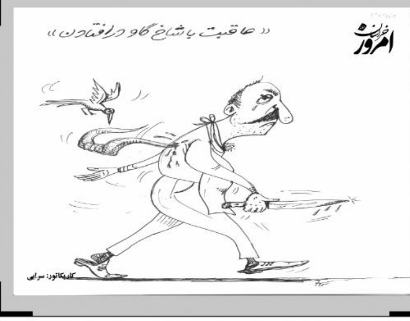
«حاقبیت با شاخ گاو رفتن» کلیدواژه: سزایی

سریست معاونت هماهنگی امور اقتصادی استانداری خراسان جنوبی گفت: اعتباراتی که برای استان تخصیص یافته نباید بر زمین بماند و باید با روحیه جهادی و تلاش انقلابی در راستای توسعه خراسان جنوبی گام‌های بلندی برداریم.