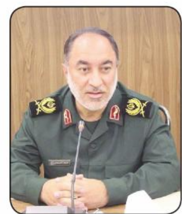
آموزش و پرورش و تربیت نسل آینده اولین گام در جهاد تبیین

امروز خراسان جنوبی - حمیدی اولین مجمع معلمان ایران اسلامی و جلسه هیات اندیشه ورز بسیج فرهنگیان خراسان جنوبی با حضور فرمانده سپاه انصارالرضا (ع) خراسان جنوبی، سرپرست آموزش و پرورش استان و جمعی از مسئولین و مدیران و معلمان از سراسر استان به صورت حضوری و مجازی برگزار شد.