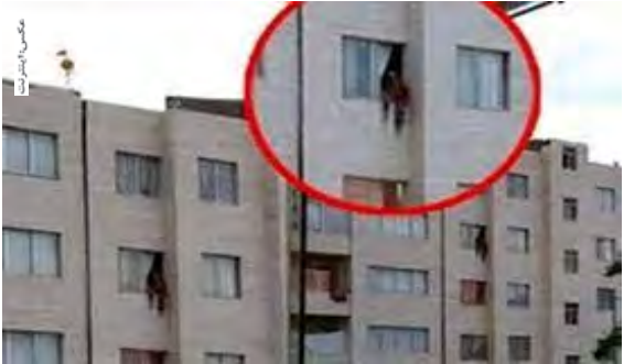
افتتاح نمایشگاه عرضه مستقیم تولیدات صندوق‌های قرض الحسنه بسیج سازندگی خراسان جنوبی

ورودی نیز چندین جفت کفش زنانه و مردانه بود که مرا متقاعد کرد خانواده‌اش خانه هستند. اما زمانی که وارد خانه شدم، کسی آنجا نبود و ناگهان پنهان به من حمله کرد و مرا مورد اذیت و آزار قرار داد.