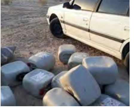
گروه حوادث/ عبدالهی

حکومت ۵۲۳ میلیون ریالی متهم قاچاق سوخت در بیرجند