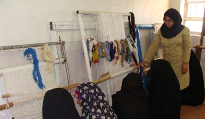
آموزش های مهارتی در استان بویژه مناطق کم کم می گیرد تا مهارت تا رسید همه خانوارهای روستایی از ظرفیت نهادهای حمایتی و خیران نیز استان جایگاه خود را در ایجاد اشتغال داشته باشد.