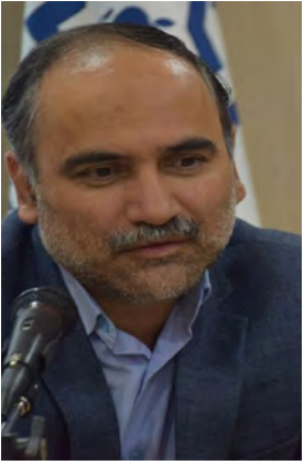
مدیرکل بیمه سلامت خراسان

این افراد می‌توانند تحت پوشش بیمه سلامت قرار بگیرند که این پوشش بیمه‌ای برای افراد سه دهک پایین جامعه، روستائیان و عشایر رایگان است. اربابی گفت: افراد فاقد پوشش بیمه می‌توانند با مراجعه به دفاتر پیشخوان و همچنین سامانه اینترنتی خدمات شهروندی به آدرس bimehsalamatiranian.ir یا