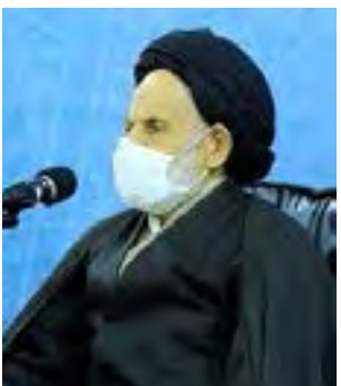
خبرنگار: مسعود حیدری

خوانندگان عزیز می توانند نظرات و پیشنهادات خود را در مورد مطالب این صفحه با ذکر تیتراژ مطلب به شماره ۰۹۹۹۶۵۰۰۰۷۶۵۰۰ پیامک یا به شماره ۰۹۳۸۲۲۲۰۷۷۰ تلگرام نمایند. آدرس کانال روزنامه: @emroozkhj