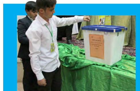
انتخابات یازدهمین دوره مجلس دانش آموزی خراسان جنوبی برگزار شد صفحه ۵