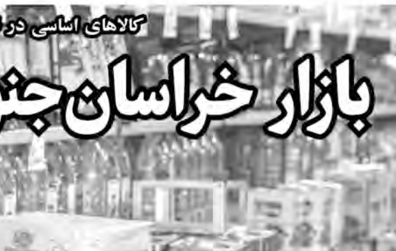
کالاهای اساسی در قفسه فروشگاه‌ها