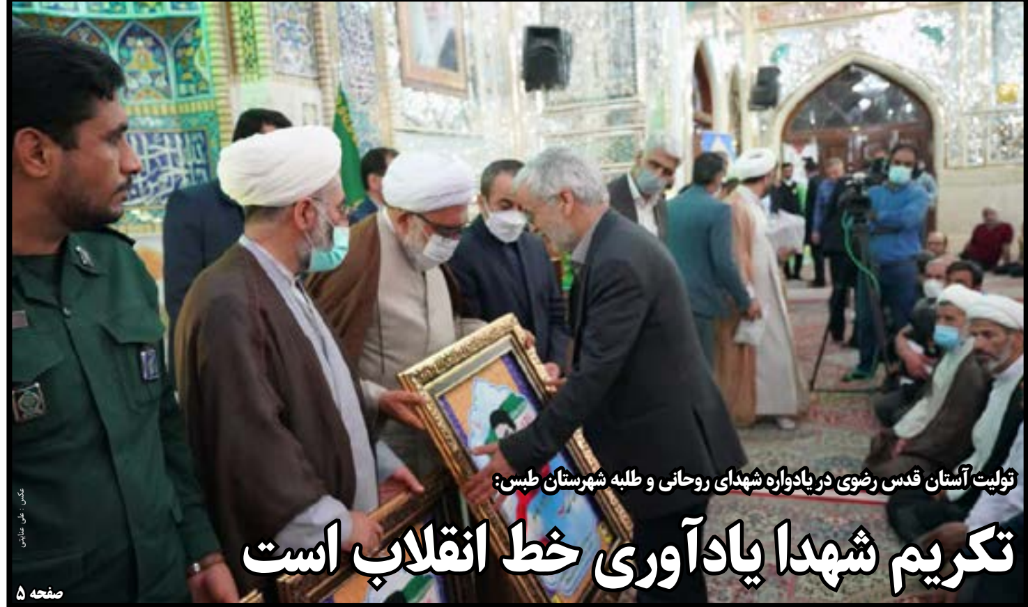
تولیت آستان قدس رضوی در یادواره شهدای روحانی و طلبه شهرستان طبس: