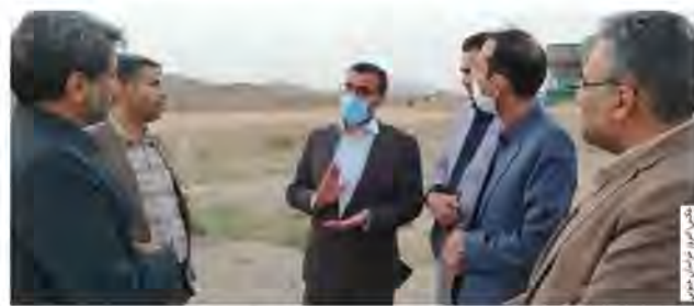
معاون هم‌انگهی امور عمرانی استاندار خراسان جنوبی از آغاز عملیات اجرایی احداث پست ۱۳۲ کیلوولت برق شهرک صنعتی شهید رحمانی خوسف در آینده نزدیک خبر داد.

و قول مساعد مبنی بر رفع مشکلات موجود برای زیرسازی، جدول‌کشی و آسفالت معابر نیز اقدامات خوبی صورت گرفته است. شهرک صنعتی شهید رحمانی خوسف به عنوان بزرگترین شهرک صنعتی استان خراسان جنوبی در چهار فاز طراحی شده و در حال حاضر برای سرمایه‌گذاری در فاز اول این شهرک به وسعت ۱۶۵ هکتار، ۱۰ سرمایه‌گذار در تولید چدن، فولاد و کک کنسانتره، کاشی و سرامیک و هیدروکربن ورود پیدا کرده‌اند.