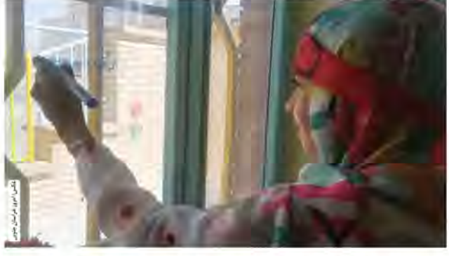
دولت‌نویس‌ها و حرف‌های خود را با مازیک بر روی پنجره‌های مرکز نوشتند و با پرچم ایران عهد بستند

ویژه برنامه‌ای به یاد پنجره‌های خرمشهر از سوی کانون پرورش فکری شماره سه بیرجند برگزار شد. اعضای کودک مرکز شماره سه بیرجند با هدف آشنایی با شجاعت و مقاومت مردم خرمشهر و همچنین ترویج فرهنگ ایثار و شهادت در این ویژه برنامه شرکت کردند. به گزارش امروز خراسان جنوبی، در این ویژه برنامه که به مناسبت