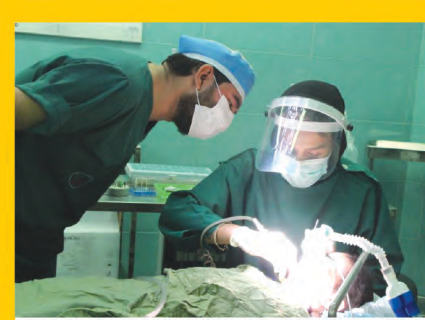
نخستین عمل جراحی دندانپزشکی تحت بیهوشی در استان انجام شد