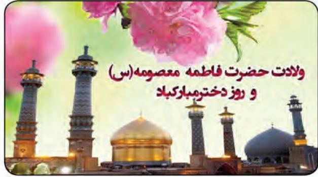
ولادت حضرت فاطمه معصومه (س) و روز دختر مبارکباد