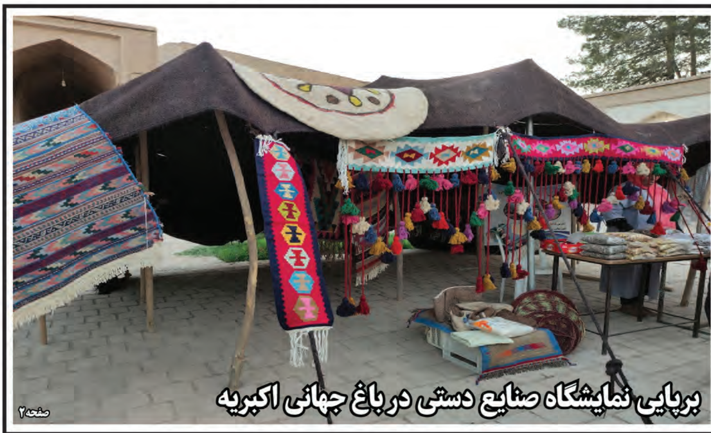
برپایی نمایشگاه صنایع دستی در باغ جهانی اکبری