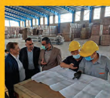
بازدید معاون امور عمرانی استانداری خراسان جنوبی از صنایع کاشی فرزاد