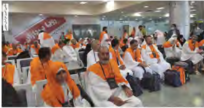
در راستای ارائه خدمات بهینه به زائران بیت ا... الحرام، نسبت به برگزاری جلسات هماهنگی حج با ادارات و ارگان‌های مرتبط اقدام کرده است تا خدمت رسانی هرچه بهتر به زائران ارائه شود.