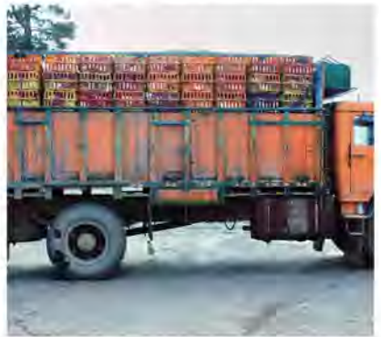
گروه حوادث/ عبداللہی

فرمانده انتظامی قاین گفت: ماموران انتظامی این شهرستان در بازرسی از یک کامیون بنز، هزار و ۳۵۰ قطعه مرغ زنده غیر مجاز و فاقد مجوز بهداشتی به ارزش ۲ میلیارد و ۲۵۰ میلیون ریال کشف کردند. به گزارش امروز خراسان جنوبی، سرهنگ محمود زال بیگی اظهار داشت: مأموران کلانتری ۱۶ نیمبلوک شهرستان قاین هنگام گشت زنی در محورهای مواصلاتی به یک کامیون بنز مشکوک شدند و خودرو را جهت بررسی بیشتر متوقف کردند. وی بیان داشت: ماموران پس از هماهنگی با مقام قضایی در بازرسی از خودرو، هزار و ۳۵۰ قطعه مرغ زنده فاقد مجوزهای بهداشتی کشف کردند که ارزش ریالی آن بنا بر نظریه کارشناس مربوطه بالغ بر ۲ میلیارد و ۲۵۰ میلیون ریال برآورد شد.