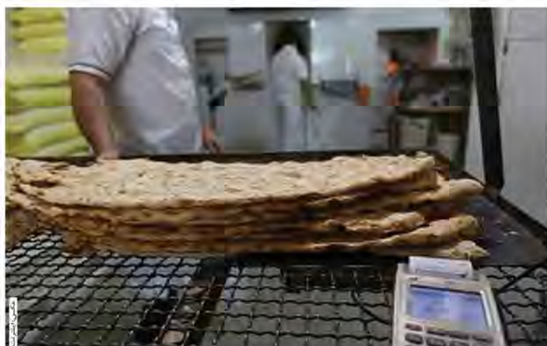
داد: با اجرائي طرح هوشمند سازي يارانه نان به هيچ وجه موضوع سهميه بندي و يا محدود كردن خريد براي مردم وجود ندارد.