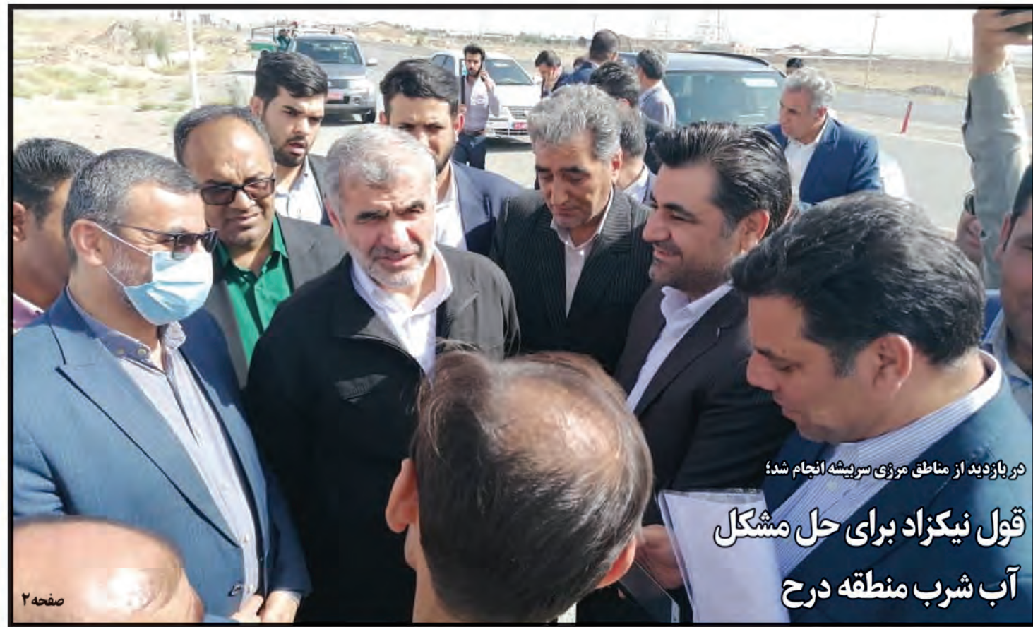
در بازدید از مناطق مرزی سریشه انجام شد؛ قول نیکزاد برای حل مشکل آب شرب منطقه درج

دولت: بچه بیارید صاحب خانه‌ها: بچه نیارید