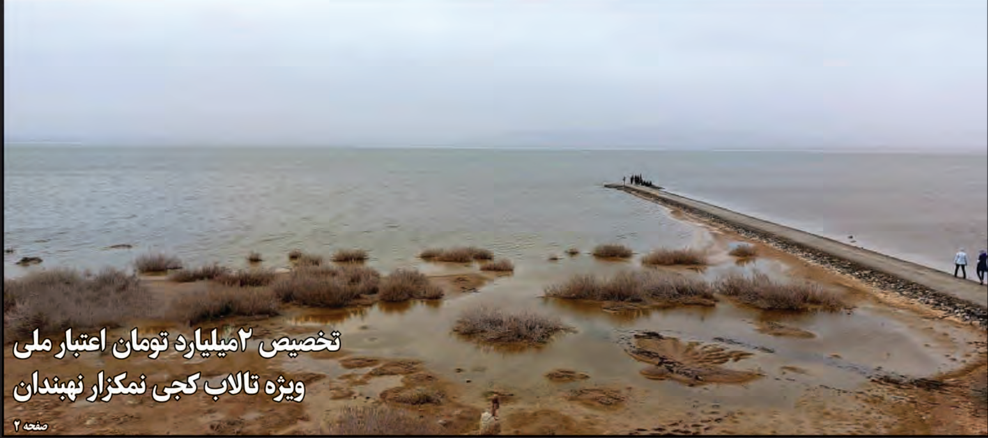
تخصیص ۲ میلیارد تومان اعتبار ملی ویژه تالاب کجی نمکزار نهبندان صفحه ۲