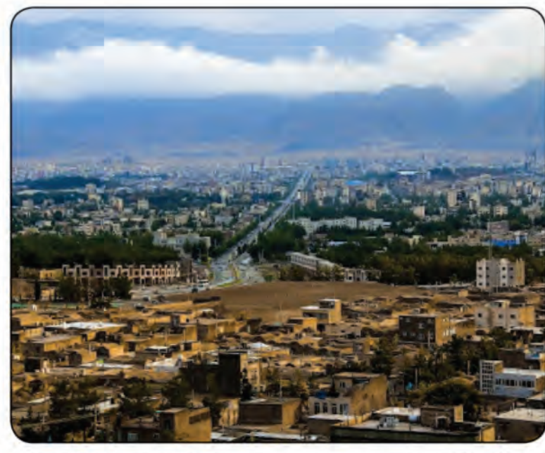
حدوداً ۱۵ تا ۲۵ درصد است. وی با بررسی مطالعات بخش مسکن در ۶ برنامه توسعه قبلی گفت: در بررسی بخش مسکن در ۶ برنامه توسعه قبلی مسکن جمع بندی کرد مسئله عدم وجود

یک بسته جامع، با ابعاد مختلف برای رفع نیازهای مختلف آحاد جامعه ایرانی با نگاه به حل مشکلات حوزه مسکن همچون بدمسکنی، بی مسکنی و نظایر آن است. وی افزود: برخوردهای موضعی و محدود برای حل مسئله مسکن بدون استفاده از ابزارهای حاکمیتی، حقوقی و قانونی سبب گردیده مسئله مسکن، به شکل پایدار و مضمّن از مسائل اصلی حوزه شهری و اجتماعی کشور باقی بماند. نگاهداری تأکید کرد: قانون جهش تولید مسکن نیز در پی راهکاری عملیاتی برای برون رفت بخش مسکن از وضعیت کنونی و تبعات آن بوده اما این قانون نیز صرفاً تمرکز خود را بر بخشی محدود از ابعاد گسترده مسکن که شامل سرمایه‌گذاری تولید و عرضه مسکن است محدود می‌شود. رئیس مرکز پژوهش‌های مجلس در خصوص فعالیت‌ها و اثرگذاری این مرکز برای بهبود وضعیت فعلی مسکن، گفت: مرکز پژوهش‌های مجلس شورای اسلامی در راستای وظایف ذاتی خود ضمن همکاری در تدوین قانون جهش تولید مسکن با پایش مستمر طرح‌های گذشته و وضعیت فعلی بازار مسکن همواره ضمن حفظ