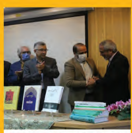
بزرگداشت دکتر حسین زنگویی صفحه ۸

مدح امیرالمومنین (ع) در شب شعر همای رحمت صفحه ۲