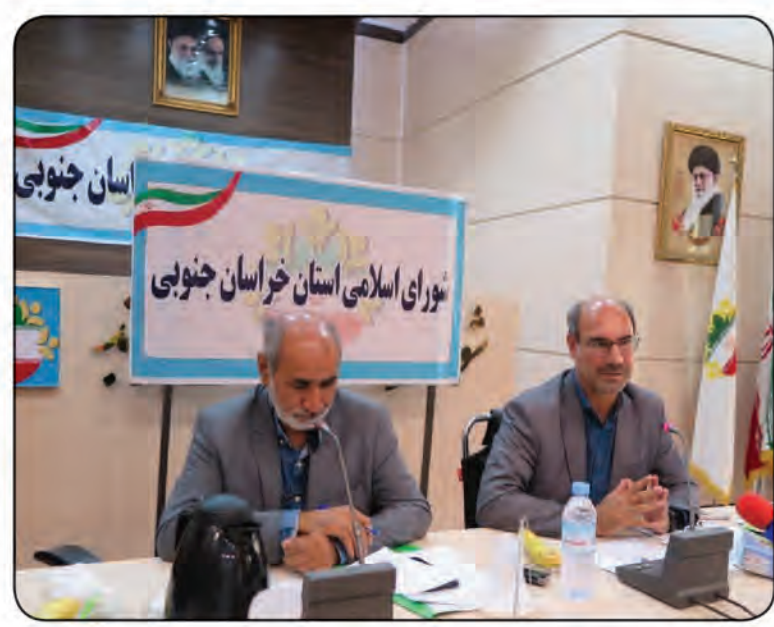
رفوع مشکلات مردم در حوزه بانگی برای اخذ تسهیلات روستایی

رکورد بنیاد مسکن خراسان جنوبی در زمینه آسفالت روستایی