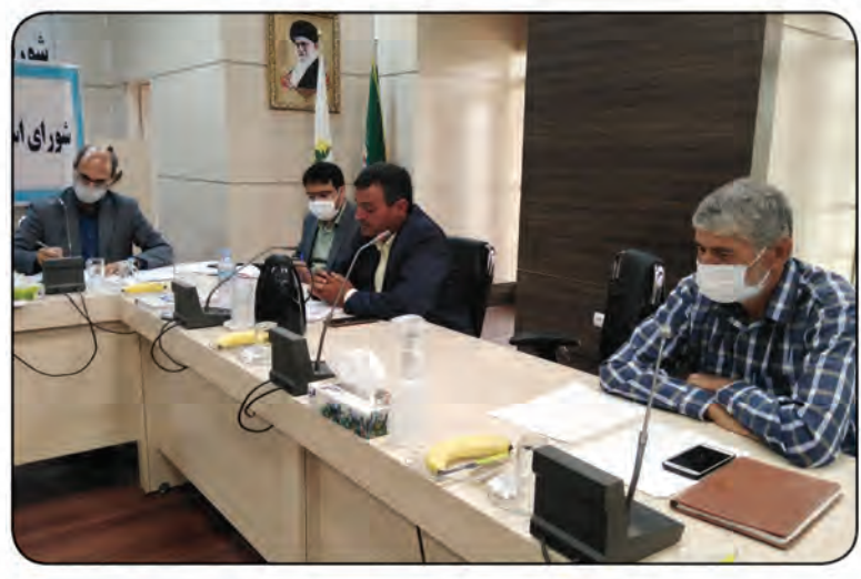
شخصی از اعضای شورای اسلامی استان در جلسه روز گذشته

همه می خواهند سر مردم کلاه بگذارند رئیس شورای اسلامی استان هم چنین از عدم ترمیم حفاری های شرکت گاز در مناطق