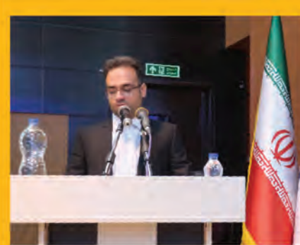
هفدهمین همایش بزرگداشت روز خانواده و تکریم بازنشستگان در استانداری برگزار شد صفحه ۵

قوانینی که در دماوند تهران با مناوند خراسان جنوبی یکسان است صفحه ۸