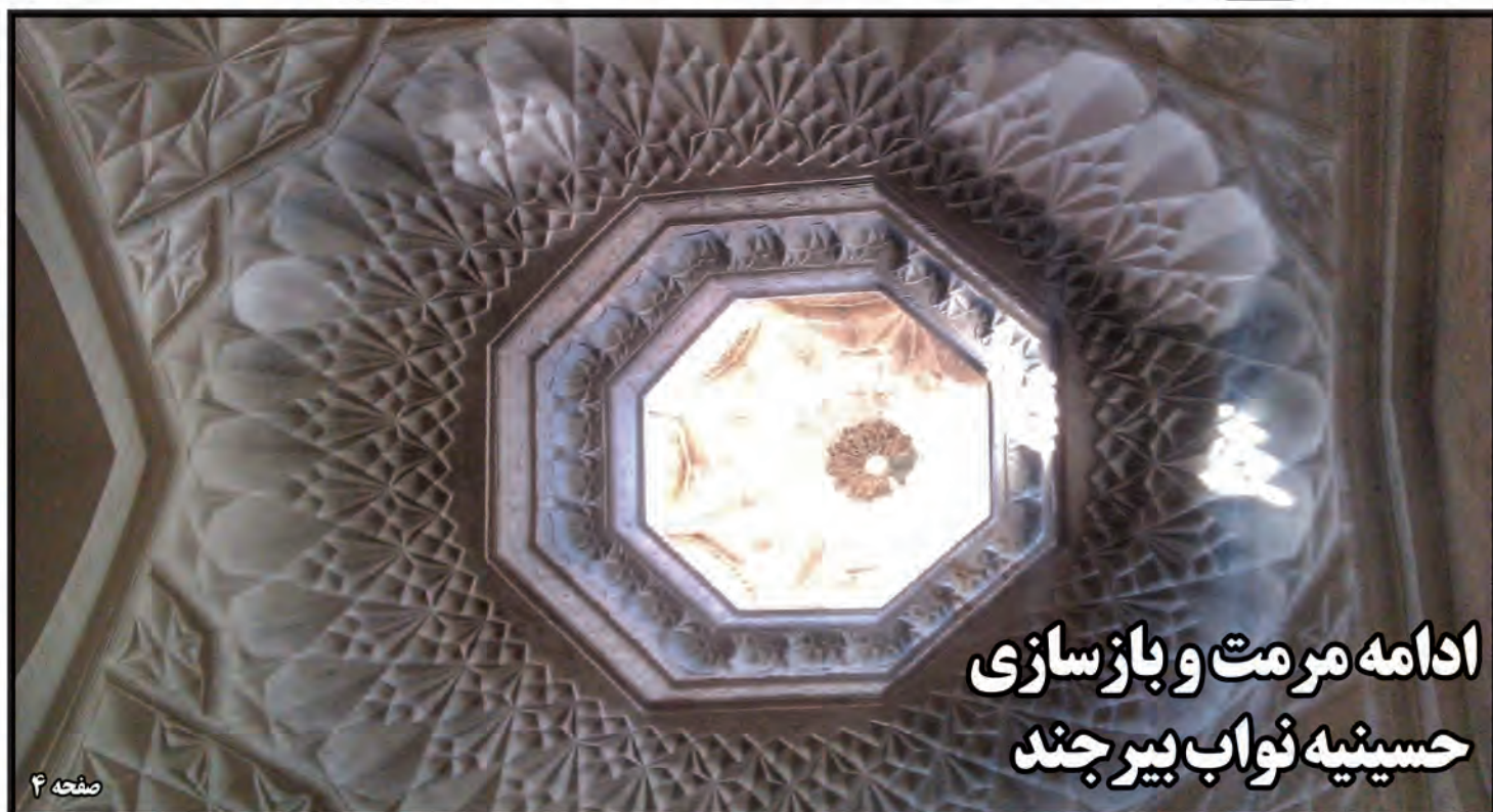
ادامه مرمت و بازسازی حسینیه نواب بیرجند