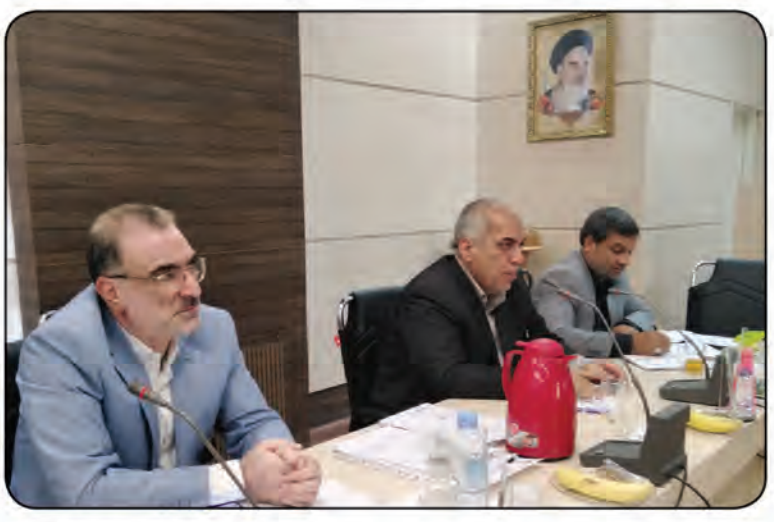
مجلس شورای اسلامی استان در جلسه روز گذشته

شاخص اجرای طرح هادی در خراسان جنوبی از میانگین کشوری بالاتر است مهندس تنها افزود: از ۹۱۸ روستای بالای ۲۰ خانوار توانستیم طرح هادی را در بیش از