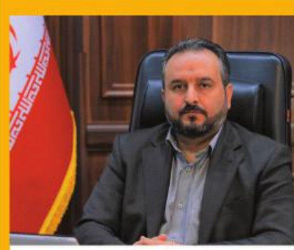
کانون ارزیابی شایستگی‌های عمومی مدیران حرفه‌ای برگزار شد

ضرورت انتقال ارزش‌های اسلامی و انقلابی با زبان هنر و شعر