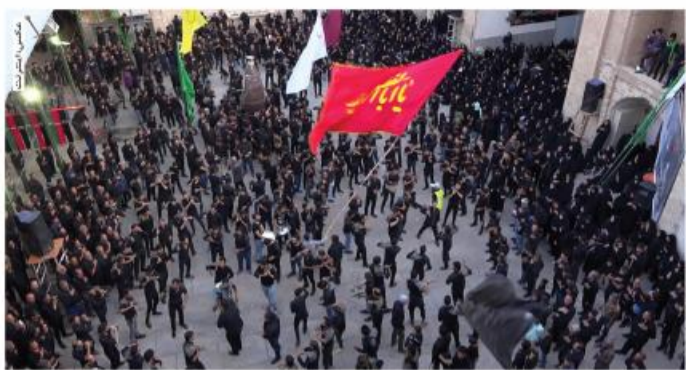
نزدیک به هزار و ۳۰۰ هیئت فعالاند که از این تعداد ۳۵۰ هیئت مربوط به بیرجند است.

با آغاز ماه محرم هزار و ۳۰۰ هیئت مذهبی در خراسان جنوبی فعالیت دارند. به گزارش خبرنگاری صدا و سیما مرکز خراسان جنوبی، محرم که از راه رسیده دلها رخت عزای حسین (ع) به تن کرده و بیرقهای عزای برافراشته شده اند. نوای عزای در کوچه پس کوچههای شهر و روستا به گوش می رسد، همه جا سیاه پوش است و همه خود را برای عزاداری حسین (ع) و یارانش آماده می کنند. دستداران امام حسین (ع) در تلاش و تکاپو هستند تا محافل و مجالس در خور شأن عزای سرور شهیدان برپا کنند. رئیس شورای هیئت های مذهبی خراسان جنوبی گفت: در خراسان جنوبی