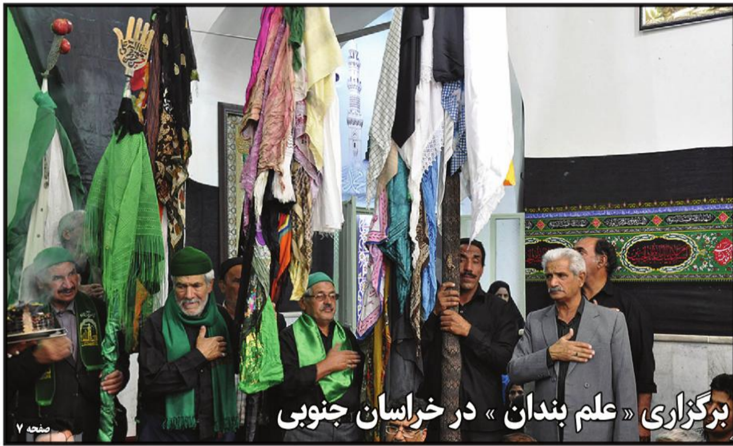
برگزاری «علم بندگان» در خراسان جنوبی