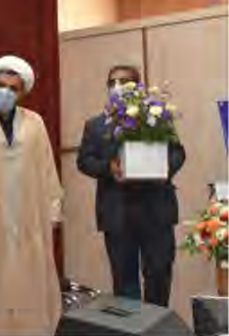
مراسم تودیع و معارفه

هزار در دانشگاه داشته ایم،افزود : امسال موجی از نخبگان به سمت دانشگاه می آیند بنابراین چرا نباید در گزینش ها دقت کنیم. وی ادامه داد: ما فارغ التحصیل بیکار نداریم و دانشجویان یکسال از تحصیل مانده مشغول بکار می شوند بنابراین باید در گزینش قوی تر باشیم و اساتید هم باید کمک کنند.