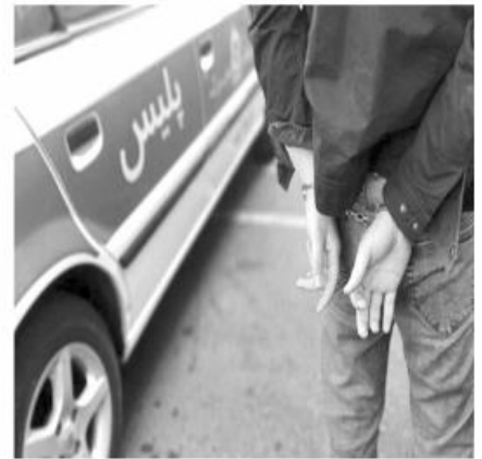
گروه حوادث / عبداللهی

ماموران انتظامی شهرستان بیرجند یک نفر سارق را دستگیر و ۲۱ فقره سرقت محتویات داخل خودرو را کشف کردند.