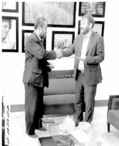
مدیرکل نوسازی، توسعه و تجهیز مدارس خراسان جنوبی اعلام کرد: