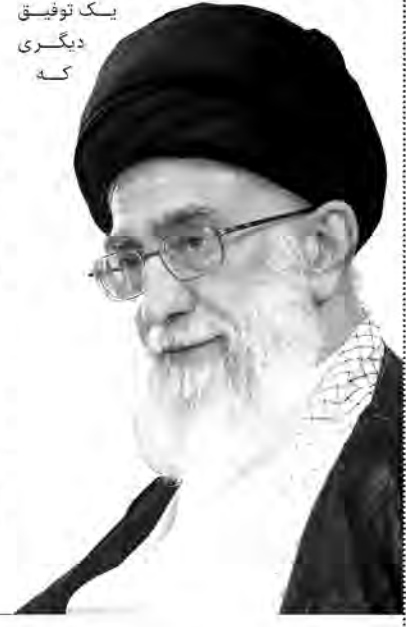
آیت الله خامنه ای

گفته می شود... رئیس سازمان دامپزشکی در پاسخ به پرسشی که آیا گزارشی از کشتار دام های مکره و غیرحلال و فروش آن به سازمان داده شده است، افزود: گزارش فروش اسب و الاغ به دست ما رسیده است، ولی در زمینه فروش سگ گزارشی به ما ندادند. از مردم تقاضا داریم که از خرید گوشت در واحدهایی که کشتار آن ها خارج از پروسه دامپزشکی است اجتناب کنند.