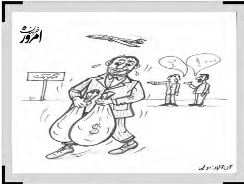
کارکاتور: س رای

به مناسبت گرامیداشت هفته دولت همایش بزرگ پیاده روی خانوادگی از انتهای بلوار شهید همت تا روستای شکراب برگزار شد. این همایش، با استقبال پرشور همشهریان ورزش دوست همراه بود، و در پایان به قید قرعه جوایزی شامل یک دستگاه دوچرخه، ۵ عدد کارت هدیه ۵ میلیون ریالی و... توسط مسئولان در همایش اهدا شد.