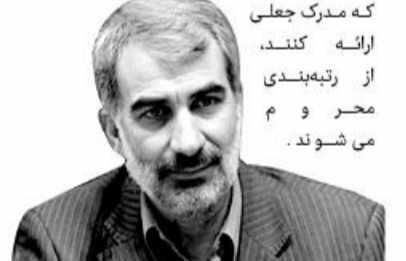
نام و نام خانوادگی

یوسف نوری، وزیر آموزش و پرورش گفت: اکنون ۸۱۰ هزار نفر مشمول رتبه بندی هستند. تعیین رتبه دوساعت بیشتر طول نمی کشد. به محض مشخص شدن رتبه، احکام جدید ۲ روز بعد صادر و فرهنگیان آن ماه با حکم جدید حقوق می گیرند. معوقات به تدریج پرداخت می شود. فرهنگیان که مدرک جعلی ارائه کنند، از رتبه بندی محروم می شوند.