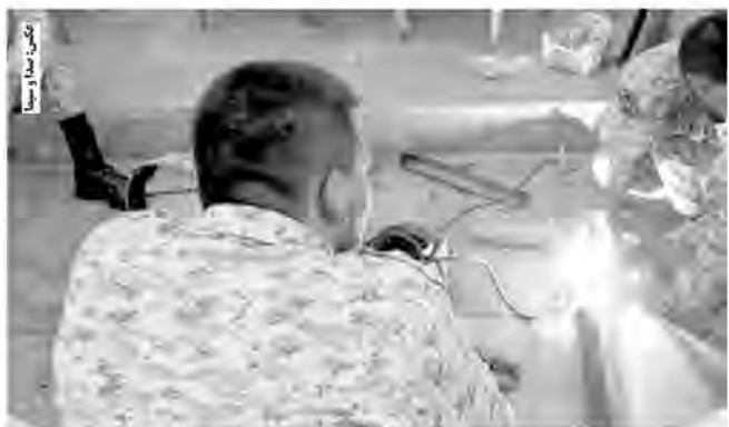
۸۲۰ دوره آموزش مهارت‌های شغلی در ۳۱۳ حرفه برای علاقه‌مندان در مراکز شهرستان‌ها برگزار کرد که ۶ هزار و ۴۲۹ کارآموز در این دوره‌ها آموزش دیدند.

۲ هزار و ۳۶ سرباز در خراسان جنوبی مهارت‌های فنی و حرفه‌ای را فراگرفتند تا پس از اتمام دوره سربازی با مهارت وارد بازار کار شوند. به گزارش خبرنگاری صدا و سیما، مدیرکل آموزش فنی و حرفه‌ای استان گفت: از آغاز امسال ۳۰۹ دوره مهارتی برای سربازان استان برگزار شده که در این دوره‌ها ۲۴۷ هزار و ۶۸۶ نفر ساعت آموزش مهارتی ارائه شده است. کارنامی فرد افزود: در این دوره‌ها ۸۷