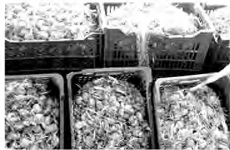
گروه حوادث عبداللهی

فرمانده انتظامی شهرستان فردوس از کشف ۵ تن پیاز زعفران قاچاق در بازرسی از یکدستگاه کامیون باری در این شهرستان خبر داد. به گزارش امروز خراسان جنوبی، سرهنگ «علیرضا فولادی» گفت: مأموران انتظامی شهرستان فردوس هنگام کنترل خودروهای عبوری در محورهای مواصلاتی به یک دستگاه کامیون باری مشکوک شدند و خودرو را جهت بررسی بیشتر متوقف کردند. فرمانده انتظامی شهرستان فردوس افزود: مأموران در بازرسی از کامیون ۵ تن پیاز زعفران قاچاق که بصورت غیر مجاز حمل می شد کشف کردند. سرهنگ فولادی با بیان این که کارشناسان ارزش بار قاچاق کشف شده را بالغ بر ۳۵۰ میلیون ریال برآورد کردند، تصریح کرد: در این رابطه خودرو توقیف و یک متهم دستگیر شد که متهم دستگیر شده با تشکیل پرونده به مراجع قانونی معرفی گردید.