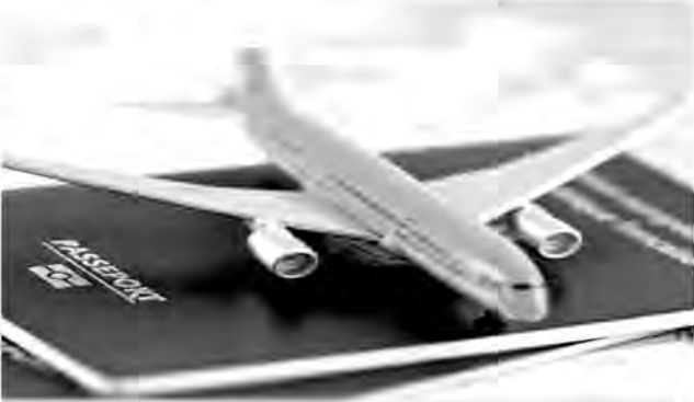
قاعده مستثنی نیست.

علی رغم وجود حدود ۵۰۰ متقاضی سفر هوایی به عتبات از خراسان جنوبی برای ایام اربعین پرواز مستقیم از فرودگاه بیرجند به مقصد عراق وجود ندارد. به گزارش مهر ایام اربعین حجم زیادی از زائران و شیفتگان ایام... عزم زیارت عتبات دارند تا نامشان در لیست کسانی که با گام های خود مسیر عشق را طی می کنند، ثبت و ضبط شود.