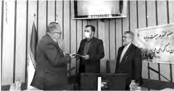
مدیر عامل شرکت ملی پست ایران اهدا لایحه ای به سرپرست اداره کل پست خراسان جنوبی با امضای لایحه ای به سرپرست، معاون وزیر و