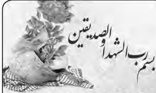
سالروز شهادت شهیدان ولی اسمعیلی، محمدرضا بابک را با ذکر صلواتی گرمی می داریم.

و درود خدا بر او، فرمود: خدایا به تو پناه می برم که ظاهرم در برابر دیده ها نیکو و درونم در آنچه که از تو پنهان می دارم زشت باشد و بخواهم با اعمال و رفتاری که تو از آن آگاهی، توجه مردم را به خود جلب نمایم و چهره ظاهر من را زیبا نشان داده و یا اعمال نادرستی که درونم را زشت کرده به سوی تو آیم و در نتیجه ای آن به بندگانت نزدیک و از خشنودی تو دور گردم.