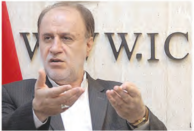
سال استفاده رسمی شدند ولی چرا باید این طرح فقط برای وزارت آموزش و پرورش به این نحو رقم بخورد.

مسئولی که برای هر پرداختی دم از آزمون گرفتن از معلم می زند اول باید خودش آزمون دهد