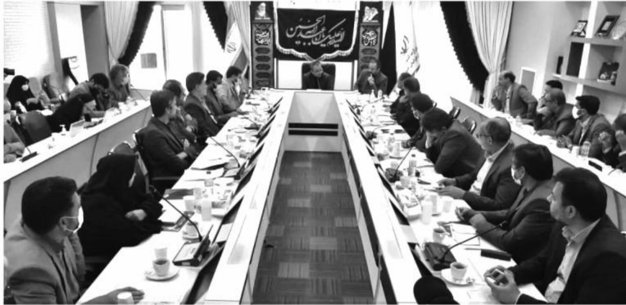
استان برگزار شد.

برنامه ریزی داده می شود که طی تعامل و همکاری با دستگاهها، در ۳-۴ مورد از این طرحها، تغییراتی اعمال نماید. استاندار خراسان جنوبی در خراسان جنوبی در دستور کار است.