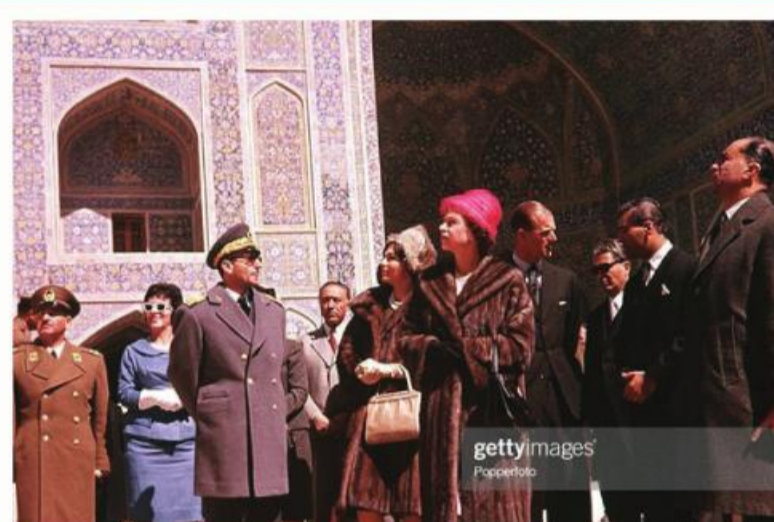
گرم دو کشور، ملکه الیزابت دوم بعد از سفر اردیبهشت ۱۳۳۸ محمدرضا پهلوی به انگلستان و در پاسخ به این سفر، ۱۱ تا ۱۵ اسفند ۱۳۳۹ به ایران آمد.

این رژیم و حمایت‌هایی که به عمل آورد و اطلاعات محرمانه دفاعی و نظامی ایران که در اختیار رژیم بعث عراق قرار داد. حتی این حمایت‌ها مورد اذعان انگلیسی‌ها نیز قرار گرفته است. در همین زمینه قاضی اسکات در گزارش ۲۰۰۰ صفحه‌ای به پارلمان انگلیس در سال ۱۳۷۵ اعلام کرد که برخلاف تعهدات بین‌المللی مبنی بر عدم تأمین تسلیحات طرفین درگیر، انگلیس مقادیر زیادی اسلحه غیرمعارف به ارزش میلیاردها دلار به عراق فروخته بود. در همین زمینه می‌توان به تحویل تانک‌های چیفتن به عراق به مبلغ یک میلیارد دلار، فروش هواپیمای جنگنده «هاوک» به مبلغ ۲ میلیارد دلار، تحویل قطعات یدکی تانک، قرارداد فروش جت‌های جنگنده «آلفا» اشاره کرد. خبرگزاری یونایتدپرس در همان اوایل جنگ در گزارشی از انعقاد قرارداد سری انگلیس با صدام برای تحویل تانک‌های چیفتن خبر داده بود. «جک استراوه» وزیر خارجه پیشین انگلیس در کتابش می‌نویسد: «ایرانی‌ها همچنین نگرانی قابل درکی درباره کلک زنده‌های بریتانیا داشتند. بریتانیا بخشی از تانک‌هایی را که ایران (در زمان شاه) هزینه شان را پرداخت کرده بود، مجدداً به صدام حسین فروخته و او در جنگ ایران و عراق ارتانک‌های خود ایران علیه او استفاده کرده بود.» سازمان ملل متحد نیز در گزارشی به کمک‌های کشورهای غربی به برنامه‌های تسلیحاتی عراق اشاره و اعلام کرد: «عراق تسلیحات خود را از ۱۵۰ شرکت آلمانی و آمریکایی و انگلیسی تهیه کرده است. براساس گزارش‌ها دولت عراق از سال ۱۹۷۵ توسط ۸۰ کمپانی آلمانی، ۲۴ شرکت آمریکایی و حدود ۱۲ شرکت انگلیسی و چند شرکت سوئیسی، ژاپنی، ایتالیایی، فرانسوی، سوندی، برزیلی و آرژانتینی تجهیزات دریافت