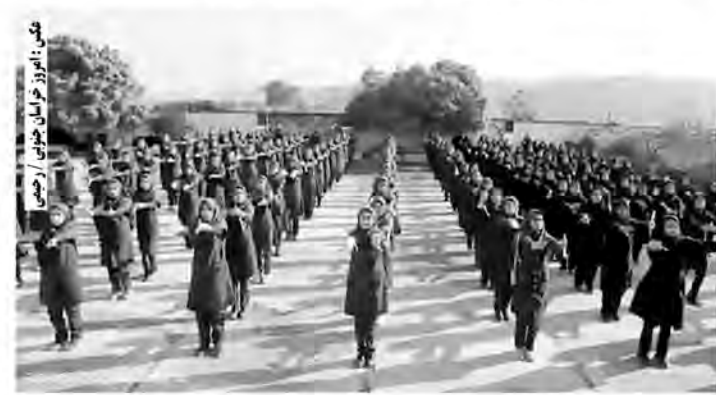
تیم آموزش عالی خراسان جنوبی در مسابقات