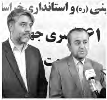
امام جمعه موقت بیرجند مطرح کرد: