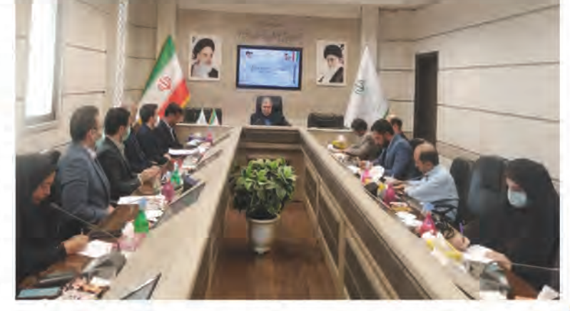
جلسه بررسی پرونده شهرک فرهیختگان