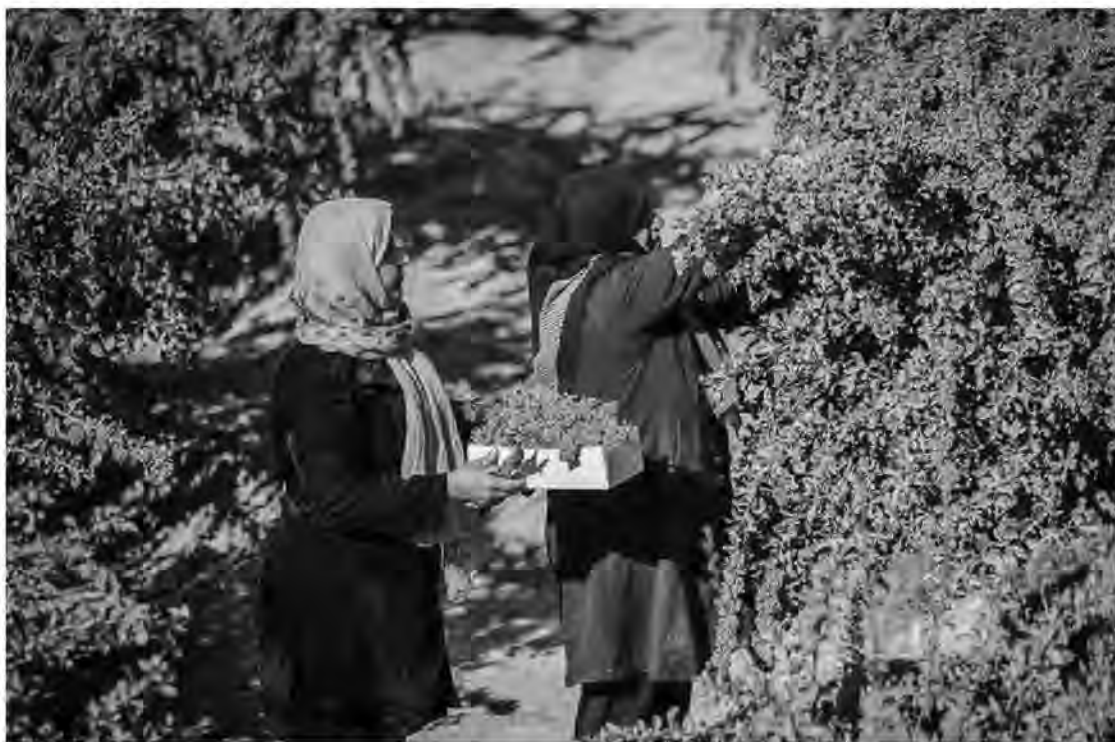
قطعه بندی شد.