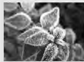
روز دوشنبه بناندن با بیشینه دمای ۳۵ درجه گرمترین ایستگاه استان و نوسانات دمای هوا در مرکز استان بین ۴ و ۲۸ درجه ثبت شد.

سریشه با کمینه دمای ۲ درجه زیر صفر برای چهارمین روز متوالی، سردترین شهر کشور بود. کارشناس هواشناسی گفت: بیرجند نیز مشترکاً با اردبیل با کمینه دمای ۴ درجه سانتیگراد دومین مرکز سرد کشور بود. نضعی افزود: تغییرات دمای هوا نیز از چهارشنبه تا جمعه افزایشی است و هوا گرمتر می شود. کارشناس هواشناسی گفت: در شب