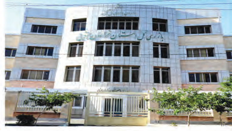
ساختمان جدید سازمان بازرسی کل استان خراسان جنوبی

وی با بیان اینکه در کنار مجموعه رسیدگی و نظارتی که انجام می شود واحد نظارت همگانی و رسیدگی به شکایات را از طریق فضای مجازی، سامانه تلفنی و مراجعه حضوری داریم، افزود: مجموع شکایات و گزارشاتی که به واحد نظارت همگانی ارسال شده در سال گذشته ۱۳۵۹ مورد بوده که ۹۱۱ مورد شکایت، ۴۴۵ مورد گزارش فساد و سه مورد شکایت همراه با نواقص بوده است. بازرسی قضایی و بازرسی کل خراسان جنوبی بیان کرد: از ۱۳۵۹ شکایت انجام شده در سال گذشته کمتر از ۱۰ مورد شکایت خاتمه پیدا نکرده اما مابقی در سال قبل خاتمه پیدا کرده است.