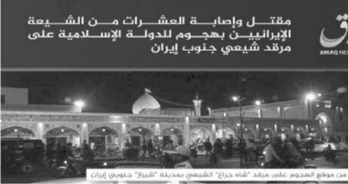
مقتل وإصابة العشرات من الشيعة الإيرانيين بهجوم للدولة الإسلامية على مرقد شيعي جنوب إيران

گفت که مطلب واقعا متعلق به اعماق است. یکی دیگر از ادعاهایی که مطرح شده در مورد زبان داعش است. در تیتربیانیه اعماق از عبارت «دولت اسلامی» استفاده شده که باعث شده برخی این شبهه را مطرح کنند که بیانیه می گوید «حمله به شاهچراغ توسط خود ایران انجام شده» این ترجمه دقیق نیست. داعش برای نامیدن خود از عبارت «دولت اسلامی» استفاده می کند. در تیتربیانیه داعش نوشته شده «بهجوم للدولة اسلامی» که به معنی «هجوم برای / توسط دولت اسلامی» است. ادعای دیگری که در مورد متن بیانیه مطرح شده این است که بیانیه اظهارات مقامات امنیتی ایران را که در نورتنیوز اعلام کرده بودند حمله توسط داعش انجام شده تکرار کرده است. این ادعا هم نادقیق است. در متن بیانیه نوشته شده «قالت مصادر امنیه لوكالة اعماق» به فارسی یعنی «منابع امنیتی به خبرگزاری اعماق گفتند». عبارتی که در متن آمده نکره یا ناشناس است و اگر اشاره آن به خبر نورتنیوز باشد، ادعای مقامات ایرانی در مورد انتساب این حمله به داعش بود باید نوشته می شد «قالت مصادر امنیه ایرانیین لوكالة اعماق» و به جای عبارت نکره از عبارت معرفی یعنی شناسا