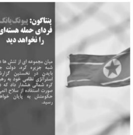
پتانگون: یونک بانگ فرادی حمله هسته ای را نخواهد دید