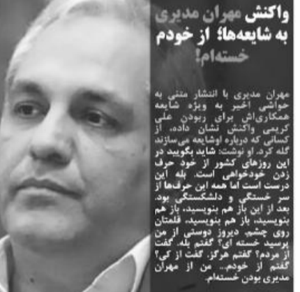
واکنش مهرا ممدیری به شایعه ها از خودم خسته ام