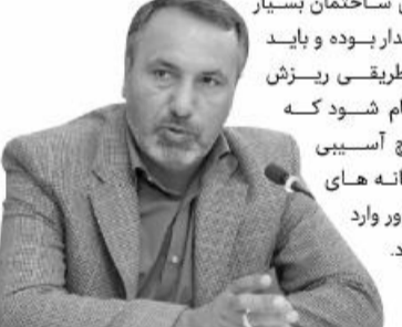
محمدرضا رضایی کوچی، رئیس کمیسیون عمران مجلس شورای اسلامی