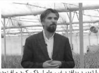
با توجه به هم مرزی خراسان جنوبی با

کشور افغانستان و اهمیت حفظ جمعیت مرزی، باید در حفظ آب های موجود و تأمین آب مورد نیاز مرزنشینان تلاش کنیم. وی با بیان اینکه در سال جاری هشت برابر نسبت به سال گذشته در حوزه قنوات تزریق بودجه داشته ایم، اظهار کرد: امید است متولیان با جمع آوری آب های روان در مواقع سیل، ضمن جلوگیری از تخریب ها، در راستای تأمین آب مورد نیاز کشاورزی استان تلاش کنند.