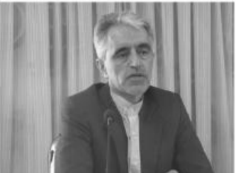
دامدار دام زیادی داشته باشد و تصور شود مبالغ سنگینی از او گرفته می شود.

پایان ۱۴۰۱ آخرین مهلت برای تمدید پروانه چرا