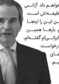
رافائل گروس، دبیرکل آژانس بین المللی انرژی اتمی

رافائل گروس، دبیرکل آژانس بین المللی انرژی اتمی گفت: ایران بایستی کارهایی که باید انجام دهد را انجام دهد. آنها تعهداتی دارند. [انجام این تعهدات] لطف کردن نیست. اگر چیزی در آنجا وجود دارد که نمی باید در آنجا بود، باید برای ما توضیح دهند. در یک مقطعی، عده ای می گفتند که من مانع اصلی توافق هستم. می توانید تصور کنید؟ من در حیطه راستی آزمایی هیچ کاری را به خاطر نمایش های سیاسی سیاسی انجام نخواهم داد. آژانس باید کاری که وظیفه اش است را انجام دهد. من این را اینجا علنی می گویم. بارها همین را به همتایان ایرانی ام گفته ام، وقتی که آنها درخواست می کنند که جاهای دیگر را بررسی کنیم.