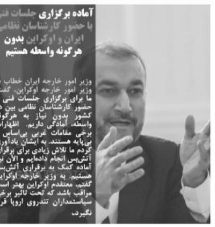
آماده برگزاری جلسات فتن با حضور کارشناسان نظامی ایران و اوکراین بدون هرگونه واسطه هستیم