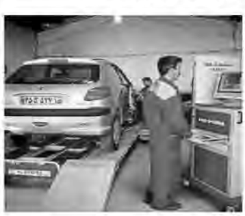
وی گفت: ۴۰ مرکز معاینه فنی تحت پوشش این اداره کل در شهرستان های بیرجند، قاین، طبس و فردوس فعالیت می کنند و تمامی