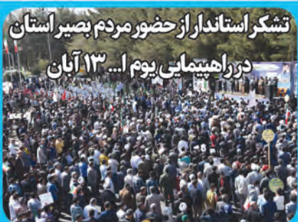
تشکر استاندار از حضور مردم بصیر استان در راهپیمایی یوم... ۱۳ آبان