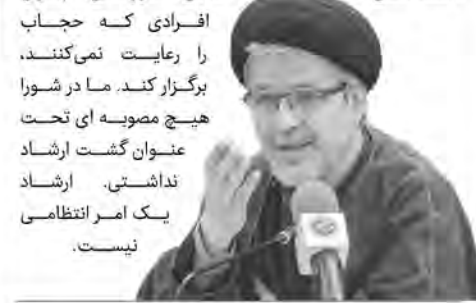
حجت الاسلام عاملی، دبیر شورای عالی انقلاب فرهنگی

حجت الاسلام عاملی، دبیر شورای عالی انقلاب فرهنگی گفت: نیروی انتظامی هم در زمینه حجاب می تواند به افراد تذکر غیرحضوری بدهد. لزومی ندارد نیروی انتظامی