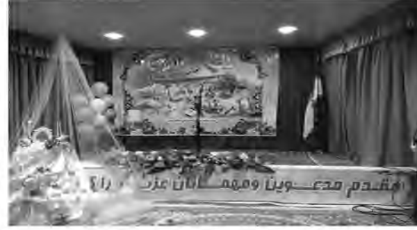
تسام جوانان استان گویبی برای برگزاری هرچه آسان‌تر مراسم ازدواج شان باشد.

۵۲ زوج طلبه خراسان جنوبی در سالروز ولادت امام حسن عسکری (ع) زندگی مشترک خود را آغاز کردند. حجت الاسلام جعفری راد رئیس مرکز خدمات حوزه‌های علمیه خراسان جنوبی گفت: مصادف با ولادت امام حسن عسکری (ع) هفتمین همایش پیوند آسمانی ۵۲ زوج طلبه جوان از شهرستان‌های بیرجند و دیگر شهرستان‌ها در شهرستان بیرجند برگزار شد. او افزود: هدف از برگزاری این همایش تشویق و ترغیب طلبان به ازدواج آسان است که البته می‌تواند برای