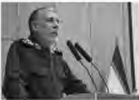
وی افزود: در این جنگ، دشمن با تمرکز بر مسئله حجاب، هدفش دین مردم بود، اما ملت