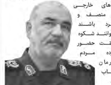
سردار حسین سلامی، فرمانده کل سپاه پاسداران انقلاب اسلامی

سردار حسین سلامی، فرمانده کل سپاه پاسداران انقلاب اسلامی در حاشیه راهپیمایی ۱۳ آبان تهران گفت: در طول مسیری که در راهپیمایی می آمدیم، مردم فقط ندای انتقام سر می دادند؛ هم دشمنان و هم ما به خوبی می دانیم که این انتقام گرفته خواهد شد. دشمنان به نیروهای خود آماده باش دادند و نگران هستند که جمهوری اسلامی اقدامی علیه آن ها نشان ندهد. بر همین اساس اکنون از بیم اقدام ایران علیه آنها در لاک دفاعی فرو رفتند. دشمنان می دانند که ما حتما نتیجه اقدامات مداخله جویانه و شرارت افروز آن ها را پاسخ خواهیم داد اما الان نمی توانیم بگوییم کجا و چگونه این اقدام را انجام خواهیم داد؛ البته اینها موضوعاتی است که برای ما می ماند و بعدها در روز حادثه دشمنان خودشان متوجه می شوند. هر کسی که آرامش مردم ما را بگیرد، آرامش نخواهد داشت.