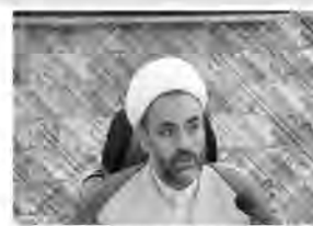
امور قرآنی و دارو و درمان به ثبت رسیده اند. مدیرکل اوقاف و امور خیریه خراسان جنوبی با بیان اینکه

در خراسان جنوبی گفت: از ابتدای سال جدید تاکنون ۴۵ وقف جدید به ارزش ۱۲۶ میلیارد ریال در خراسان جنوبی ثبت شده است. حجت الاسلام بخشی‌پور ادامه داد: بیشتر موقوفات با نیت امور خیر و عام المنفعه، عزاداری ائمه اطهار (ع)، تأمین هزینه‌های مساجد، بقاع متبرکه و حوزه‌های علمیه، کمک به ایتم و فقرا و مستمندان،