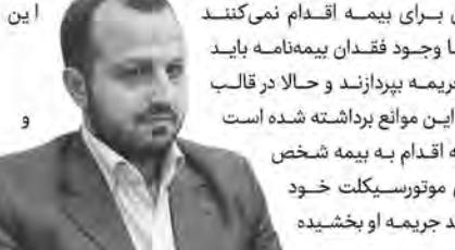
احسان خاندوزی، وزیر امور اقتصادی و دارایی

احسان خاندوزی، وزیر امور اقتصادی و دارایی گفت: قریب به ۱۲ میلیون موتورسیکلت فعال داریم که کمتر از ۲ میلیون موتورسیکلت بیمه نامه شخص ثالث دارند و با توجه به الزام قانونی برای برخورداری از بیمه، در شرایط بروز حادثه فقدان بیمه موجب خسارت زیادی به موتورسواران می شود. یکی از موانعی موتورسواران برای بیمه اقدام نمی کنند است که با وجود فقدان بیمه نامه باید یک سال جریمه بپردازند و حالا در قالب این ابلاغیه این موانع برداشته شده است