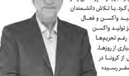
بهرام عین اللهی، وزیر بهداشت، درمان و آموزش پزشکی

نیاز به تولید دارد تا بتوان بسیاری از نیازهای کشور در حوزه های مختلف داخل دارو و تجهیزات پزشکی را در داخل تأمین کرد. با تلاش دانشمندان ایرانی در تولید واکسن و فعال شدن ۶ مرکز تولید واکسن در کشور، به رغم تحریم ها اکنون در بسیاری از روزها، فونت ناشی از کرونا در کشور به صفر رسیده است.