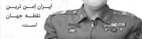
امیر پوردرستان، رئیس مرکز مطالعات راهبردی ارتش جمهوری اسلامی

امیر پوردرستان، رئیس مرکز مطالعات راهبردی ارتش جمهوری اسلامی گفت: به خیال خود می خواستند کار نظام را یکسره کنند، ولی این نظام باز به مسیرش ادامه داد. بر خلاف سال ۸۸ تاکنیک هایشان متفرق بود، پلیس ما دختر جوان را با نهایت احترام سوار ون می کند می آورد در سالن توجیه می کنند.