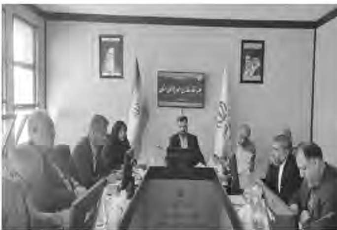
افراد جامعه بسیار تأثیر گذار است.

زوجها از تسهیلات ازدواج و مسکن فراهم شده که این امر سبب تسهیل ازدواج شده است.