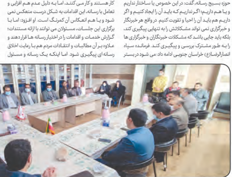
فرمانده سپاه انصارالرضاع (ع) خراسان جنوبی تصریح کرد: خدماتی که بسیج در کشور برای ساختن ایران قوی انجام داده، کم نیست. در واقع نقش بسیج در حوزه سازندگی، مسائل دفاعی و امنیتی، حضور در خط مقدم ۸ سال دفاع مقدس و اهدای بیشترین تعداد شهید به انقلاب، بی‌نظیر است. همچنین از ابتدای انقلاب تاکنون بسیج در مقابل