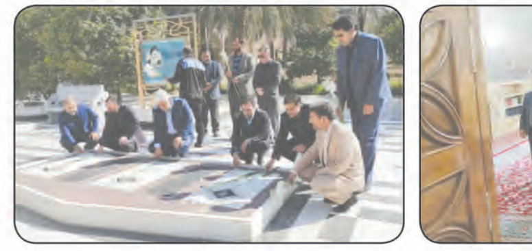
دنیال تقویت نهضت مهارت آموزی هستیم و در این راه همکاری و همیاری همه ضروری است. در پایان مراسم از خانواده شهدای اداره کل با لوح هدایایی تقدیر و تندیس یادواره به مدعوین اهدا شد. بخش معنوی خادمان حرم آهنگ های انقلابی، حضور معنوی خادمین حرم حضرت ثامن امام رضا(ع)، مداحی و... از جمله برنامه های این مراسم بود. این مراسم به صورت زنده و برخط به صورت ویدئو منتشر خواهد شد.

به جای اینکه در مسیر خداوند قرار گیرند به دنبال پستی، پلشتی، قتل و غارت هستند اما خداوند بندگان را دوست دارد و این اراده اوست که در این دنیای کفر آخرازمایی یک پایگاه برای حیات انسانی و حیات الهی به وجود آورد و شهدا این مسیر را رفته‌اند. وی بیان کرد: این سال‌ها وقتی مسیر اربعین حسینی باز می‌شود از کشورهای مختلف جهان، شیعه و سنی و سایر ادیان به‌خصوص افرادی از کشورهای غربی راهی کربلا می‌شوند و خواستار عدل، عقل و مصالح هستند. نماینده ولی فقیه در خراسان جنوبی گفت: اگر شرایط فراهم شود آنها از ما جلوتر هستند و از اربعین حسینی، انتظار ظهور حضرت مهدی (عج) و نجات بشر را دارند تا بشر از دست ستمگران نجات پیدا کند، زنده شود و به حیات طبیعی و الهی برسد. پیام شهدا پیام امید و تلاش برای سازندگی و اعتدالی نظام است رئیس شورای هماهنگی امور فرهنگی و اجتماعی سازمان آموزش فنی و حرفه‌ای کشور نیز در این