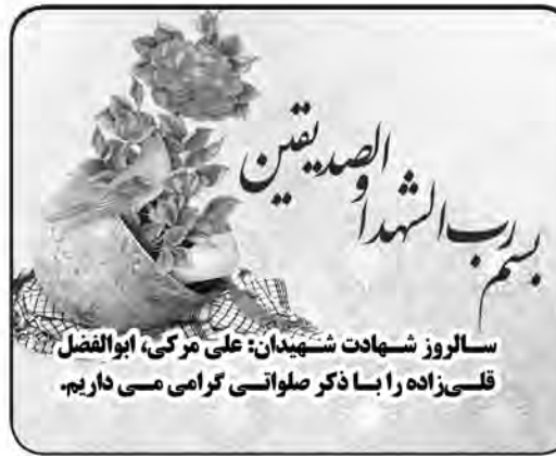
سالروز شهادت شهیدان: علی مرکی، ابوالفضل قلی زاده را با ذکر صلواتی گرامی می داریم.

از گمان های بد به مؤمنان پرهیزید که خدا حق را بر زبان آنان نهاده است.