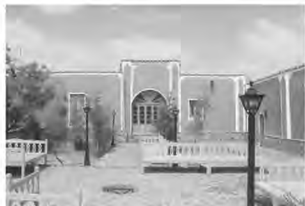
شده است وی گفت: برای این زمینه اشتغال برای ۱۲ نفر فراهم

اقامتگاه‌ها یک میلیارد و ۵۰۰ میلیون تومان سرمایه‌گذاری شده است. وی گفت: آخر هفته و پنجشنبه اقامتگاه‌های بوم گردی پر است. معاون گردشگری اداره کل میراث فرهنگی، گردشگری و صنایع دستی خراسان جنوبی با اشاره به اینکه توسعه کمی و کیفی در مناطق کم‌برخوردار از جمله برنامه‌های این اداره کل محسوب می‌شود، افزود: در خراسان جنوبی ۸۱ اقامتگاه بوم گردی وجود دارد که زمینه اشتغال برای حدود ۲۰۰ نفر را فراهم کرده است.