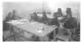
انواع اسلیمی ها و انواع گل ها و برگها آشنا می شوند.

امروز برگزاری دوره های آموزش کوتاه مدت صنایع دستی مورد توجه بوده است، از سوی دیگر فراهم کردن حرفه آموزی متقاضیان در راستای فراهم کردن زمینه اشتغال جوانان و نوجوانان جوانی کار موضوعی است که با برگزاری آموزش های فولادی گفت: بسط و توسعه رشته های صنایع دستی از جمله اهدافی است که در