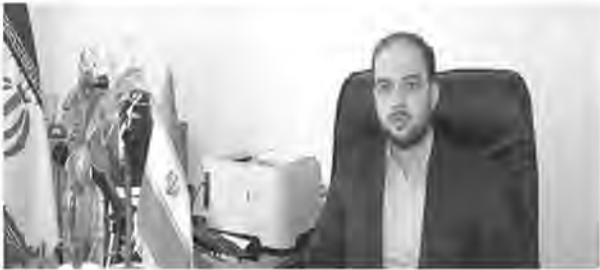
دادوریه، طی نامه‌ای خطاب به اداره جهاد کشاورزی دستور ویژه‌ای صادر کرده بودیم.