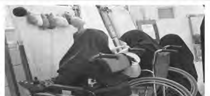
صنعتی و کشاورزی بوده است. وی بر اجرایی شدن قانون جامع حمایت مددجویان از سوی دستگاه‌های اجرایی تأکید کرد و در همین ارتباط تلاش شده با تأمین