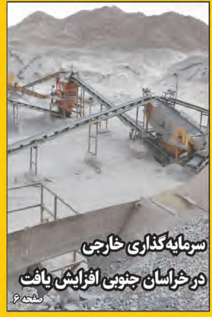
سرمایه‌گذاری خارجی در خراسان جنوبی افزایش یافت

فعالیت ادارات خراسان جنوبی پیوست رسانه‌های داشته باشد