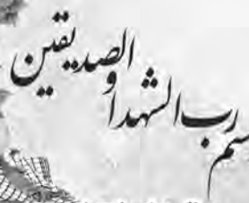
سالروز شهادت شهید: حسین ابوانی را با ذکر صلواتی گرامی می داریم.

دل ها را روی آوردن یا نشاط و پشت کردن یا فراری است، پس آنگاه که نشاط دارند آن را بر انجام مستحبات وا دارند و آنگاه که دل، روی برگرداند و پشت نماید، بی نشاط است، پس به انجام واجبات بسنده کنید.