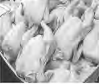
اندازه کافی در استان انجام شده و در این خصوص هیچ مشکلی نداریم.

مصرف داخلی استان است و بقیه به استان های همجوار ارسال می شود. رئیس سازمان جهاد کشاورزی خراسان جنوبی افزود: در استان افزایش قیمتی در خصوص تخم مرغ هم نداشته ایم و با همان قیمت مصوب عرضه می شود اما در مجموع در کل کشور در فصل سرما تولید تخم مرغ کاهش پیدا می کند. وی با اشاره به اینکه تأمین نهاده ها از طریق سامانه توسط دولت انجام می شود، بیان کرد: به اندازه کافی نهاده با قیمت مصوب وجود دارد و مشکلی در این خصوص نداریم.