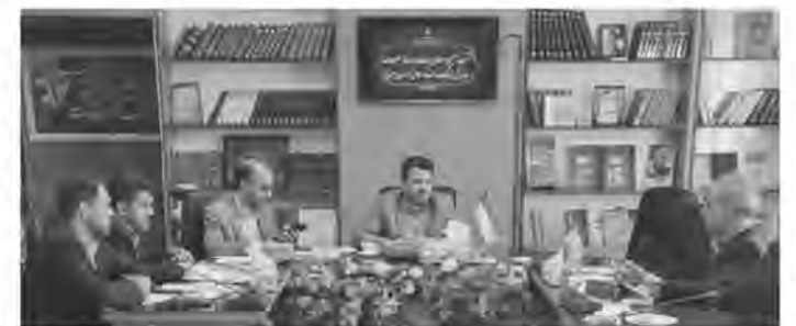
اهمیت پیوست رسانه ای فعالیت ها تقویت شود، اظهار کرد: پیوست رسانه ای فعالیت های دستگاهها و تقویت رسانه ها نقش بسزایی در توسعه فرهنگی دارد که این امر نیازمند توجه هر چه بیشتر به ظرفیت بالای خبرنگاران است. فرخنده با بیان اینکه امید است در این مجلس قانون خوبی در راستای حمایت از رسانه‌ها دیده شود، گفت: جنگ امروز جنگ روایت‌ها بوده و غرب با نداشته

های خود از هیچ، همه چیز می‌سازد. مدیرکل فرهنگ و ارشاد اسلامی خراسان جنوبی با بیان اینکه باید نگاه مسئولان به اهمیت پیوست رسانه ای فعالیت‌ها تقویت شود، ادامه داد: انتظار می‌رود رسانه‌ها با استفاده از ظرفیت‌های انقلاب، آنچه که شایسته و مد نظر نظام است را روایت کنند. وی بیان کرد: امیدواریم بتوانیم با استفاده از ظرفیت خبرنگاران در حوزه جهاد تبیین که خروجی آن امیدآفرینی است، اقدامی مؤثر در جامعه داشته باشیم. در این جلسه مشکلات فعالان رسانه ای استان اعم از خدمات رفاهی، معیشتی و مسکن خبرنگاران و دغدغه‌های رسانه‌ها با دستگاه‌ها مطرح شد.