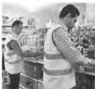
اشاره به اینکه طرح تاها از سال

(طرح اجرای هماهنگ استاندارد) ۲ هزار و ۹۱۶ بازرسی از مراکز عرضه کالا انجام شده است که نسبت به مدت مشابه پارسال افزایش ۱۶ درصدی داشته است. او با بیان اینکه در نیمه نخست امسال ۵۷ نمونه برداری انجام شده است، اظهار کرد: نمونه برداری از کالاهایی مانند گلاب، خرما، محافظ الکترونیکی، سیم و کابل، روغن موتور و روغن هیدرولیک انجام شده است. صادقی گیو با