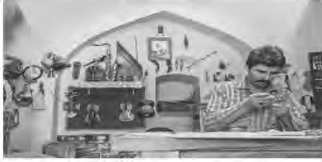
بودجه سال ۱۴۰۰، تعداد ۱۲۵ طرح اشتغالزایی مستقل و گروهی در