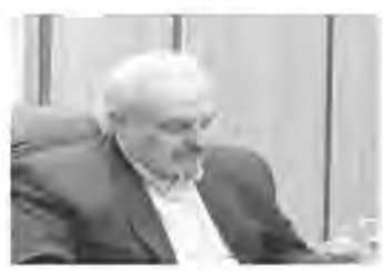
می‌گیرد و روند اعطای وام ازدواج زودتر صورت می‌گیرد.

خود را تکمیل و بانک ظرف مدت ۱۰ روز اقدام به پرداخت وام کند. او عنوان کرد: پرداخت تسهیلات به نیروی انسانی نیز بستگی دارد که هم اکنون در استان کمبود شدید نیرو داریم و در بحث منابع نیز تمام منابع در مخزن بانک مرکزی است و خود بانکها دخالتی در آن ندارند. زنگ گفت: هر چقدر مردم بیشتر در بانکها حساب قرض الحسنه باز کنند منابع بیشتری در اختیار بانکها قرار