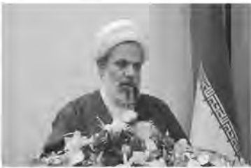
از دستاوردهای ایران قوی است که دیگر تهدید و تحریم دشمنان اثری ندارد.

ایران اسلامی در زمینه های سیاسی، اقتصادی و علمی، انسجام جریان مقاومت اسلامی استفاده می کند. وی به اغتشاشات اخیر اشاره کرد و افزود: دشمنان با جنگ ترکیبی و جریان نفاق به میدان آمدند، اما هوشیاری مردم ایران این توطئه ها را خنثی کرد و با توکل به خدا و با روحیه جهادی و دلسوزی مدیران از این دوران هم عبور خواهیم کرد. امام جمعه موقت بیرجند گفت: پیشرفت اروپایی به شدت مضطرب هستند و این