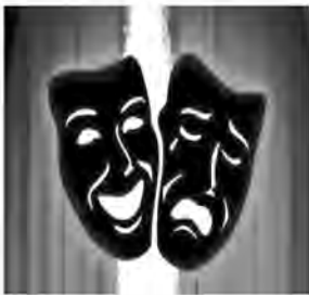
بیرجند برگزار خواهد شد. فرخنده با بیان اینکه موضوع

نمایش های حاضر در جشنواره آزاد بوده و ملاک انتخاب آثار کیفیت آن است، افزود: گسترش فرهنگ ایثار، شهادت، مقاومت، آسیب های اجتماعی، بهره گیری از مفاهیم و جلوه های تاریخ، فرهنگ و ادبیات غنی ایران و توجه به فرهنگ عامه و ارزش های بومی، تاریخی و ادبی استان از جمله محورهای مورد تأکید ستاد این جشنواره است.