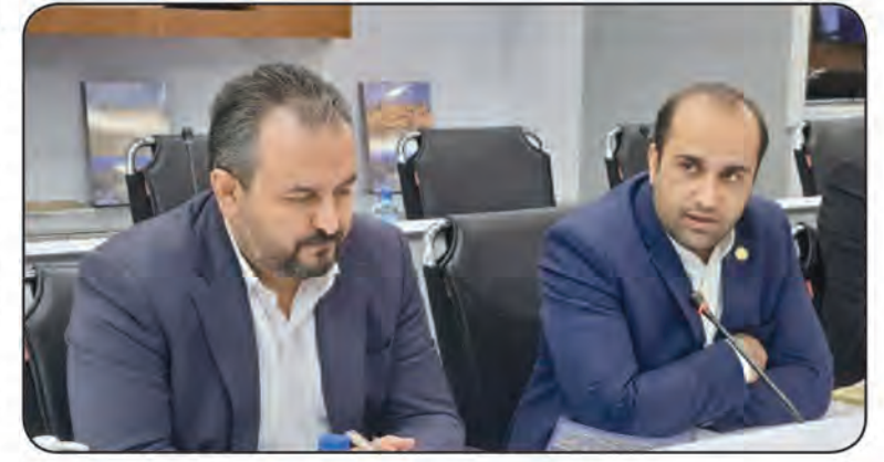
مدیرکل کتابخانه های عمومی استان ساخت کتابخانه مرکزی را خواسته همه هم استانی های خراسان جنوبی دانست و با جهادی دانستن رویکرد دکتر قناعت از ایشان خواست نسبت به دستور کار قراردادن این خواسته در سفر دوم رئیس جمهور به