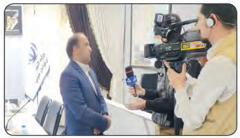
بازهم برای نخستین بار در استان برای خیر کتابخانه ساز، معافیت مالیاتی گرفتیم و پیش از دو برابر کتاب های ارسالی از نهاد، با برقراری ارتباط با ناشرین و خیرین کتاب هدایی دریافت داشتیم.

استان دستور مقتضی را صادر فرمایند که استاندار خراسان جنوبی همان جا دستور داد تا علاوه بر قرار گرفتن این موضوع در پیشنهادات سفر دوم آیت ا... رئیسی از طریق وزارت فرهنگ و ارشاد اسلامی نیز پیگیری شود. در ادامه برخی از اعضای انجمن در خصوص کتاب و کتابخوانی اظهار نظر نموده و در پایان نیز احکام ۴ عضو حقیقی انجمن کتابخانه های عمومی استان که به امضای دکتر قناعت استاندار و رئیس محترم انجمن کتابخانه های عمومی استان رسیده بود به