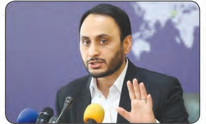
سخنگوی دولت گفت: زمین جنگ در فضای مجازی زمین بازی دشمن است ما سعی داریم شبکه ملی اطلاعات را تقویت کنیم

و سیما؛ دکتر علی پهبادی در دیدار با نخبگان و اساتید حوزه و دانشگاه‌های مشهد گفت: سال‌های سال است که دشمن تلاش می‌کند تا استقلال کشور را زیر سوال ببرد. با برداشتی که شیوه حکمرانی در ده سال گذشته دستخیز متأسفانه نگاه این بود که مشکلات از گفتگو با پشت میز نشسته‌های آن روز آبی حل کرد، آمار و ارقام این را نشان می‌دهد که این نگاه مکمل تحریم شد. وی ادامه داد: با توجه به اینکه در این ده سال تمام توجه‌ها و تمرکزها به اقتصاد بود، نتیجه‌اش باید رشد اقتصادی می‌بود که اینگونه نشد، یعنی کشور در موضوع اقتصادی درجا زد. بنا بر اعلام وبگاه نهاد نماینده‌ی رهبری در دانشگاه‌ها، سخنگوی دولت عامل تورم را افزایش نقدینگی در دولت‌های قبلی دانسته و گفت: کشور به سمت افزایش نقدینگی و تورم رفت تا جایی که اقتصادی مریض به دولت سیزدهم تحویل داده شد. این دولت تمام تلاش خود را کرده و می‌کند تا بتواند تورم و موتور پهبادی چهرمی ادامه داد: به این دلیل که زمین جنگ در فضای مجازی، زمین بازی دشمن است ما سعی داریم شبکه ملی اطلاعات را تقویت کنیم و به همین منظور ۶ هزار میلیارد تومان به تقویت شبکه ملی اطلاعات بودجه تخصیص داده شده است. نماینده‌ی رهبری در دانشگاه‌ها، سخنگوی دولت عامل تورم را افزایش نقدینگی در دولت‌های قبلی دانسته و گفت: کشور به سمت افزایش نقدینگی و تورم رفت تا جایی که اقتصادی مریض به دولت سیزدهم تحویل داده شد. این دولت تمام تلاش خود را کرده و می‌کند تا بتواند تورم و موتور پهبادی چهرمی ادامه داد: به این دلیل که زمین جنگ در فضای مجازی، زمین بازی دشمن است ما سعی داریم شبکه ملی اطلاعات را تقویت کنیم و به همین منظور ۶ هزار میلیارد تومان به تقویت شبکه ملی اطلاعات بودجه تخصیص داده شده است.